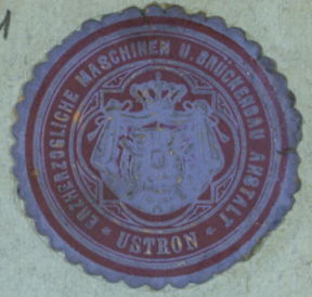
1 Kuzněna - Ustroj dleu. Fabk. Uvaz. Rok 1906.