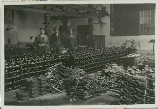
Kouřebke Kuz. Ustro Zprac. 1937. r.