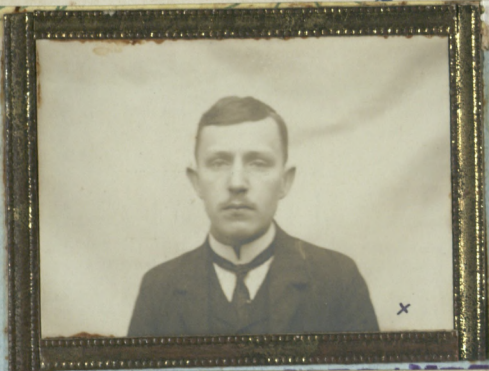
Ldji. 1911 r.