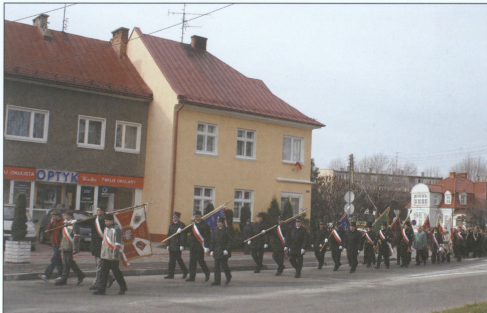
Przemarsz pochodu z kościoła ewangelicko-augsburskiego ap. Jakuba pod pomnik za ratuszem – 11 listopada 2006 r.