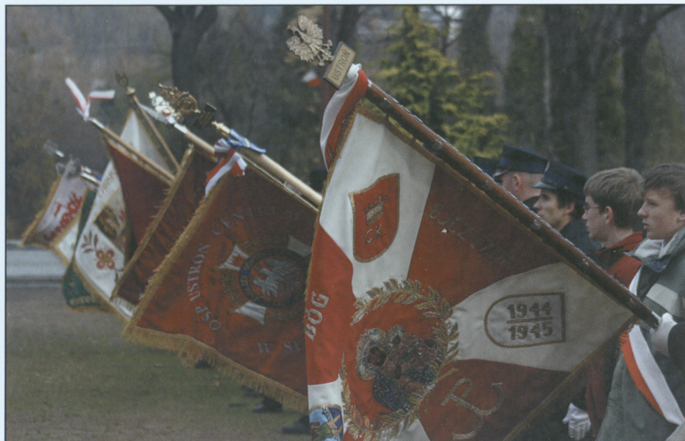
Sztandary różnych instytucji i organizacji uczestniczących w uroczystościach pod pomnikiem Pamięci Narodowej – 11 listopada 2006 r.