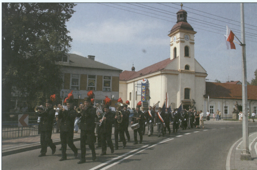
Przemarsz uczestników uroczystości patriotycznej z kościoła pw. św. Klemensa pod pomnik za ratuszem – 15 sierpnia 2008 r.