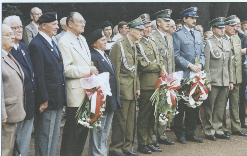
Przedstawiciele kombatantów i służb mundurowych w trakcie ceremonii pod pomnikiem Pamięci Narodowej – 15 sierpnia 2003 r.