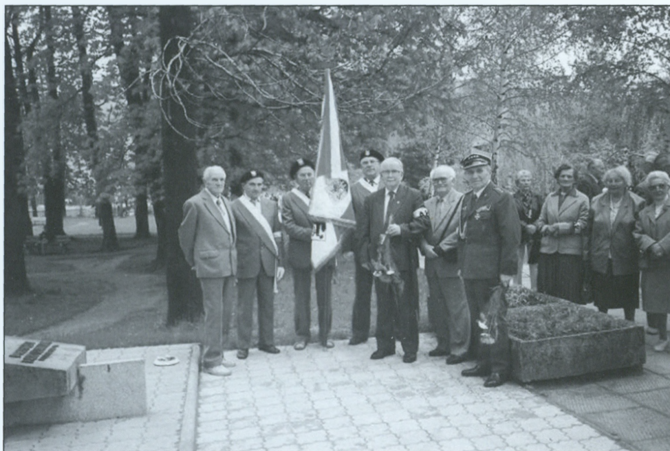
Sierpniowe uroczystości z okazji 75-lecia bitwy warszawskiej i rocznicy powstania warszawskiego; przedstawiciele AK przy pomniku na ul. Partyzantów – 1995 r.