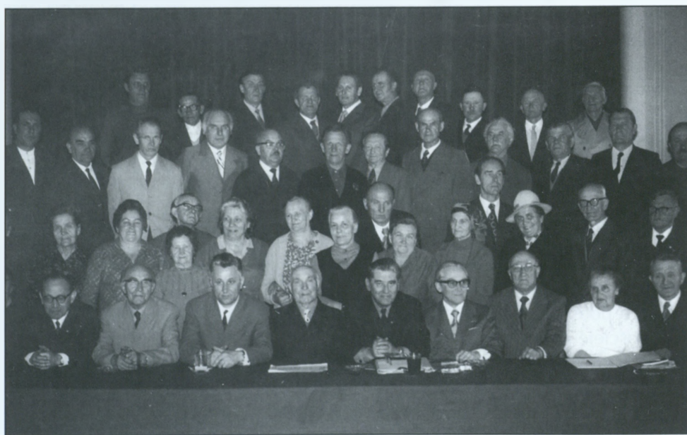
Członkowie ZBoWiD – 1974 r.

Kombatanci spotykają się regularnie w jednej z sal Miejskiego Domu Kultury „Prażakówka”, a przewodniczący poszczególnych organizacji w określonych dniach pełnią tam dyżury.