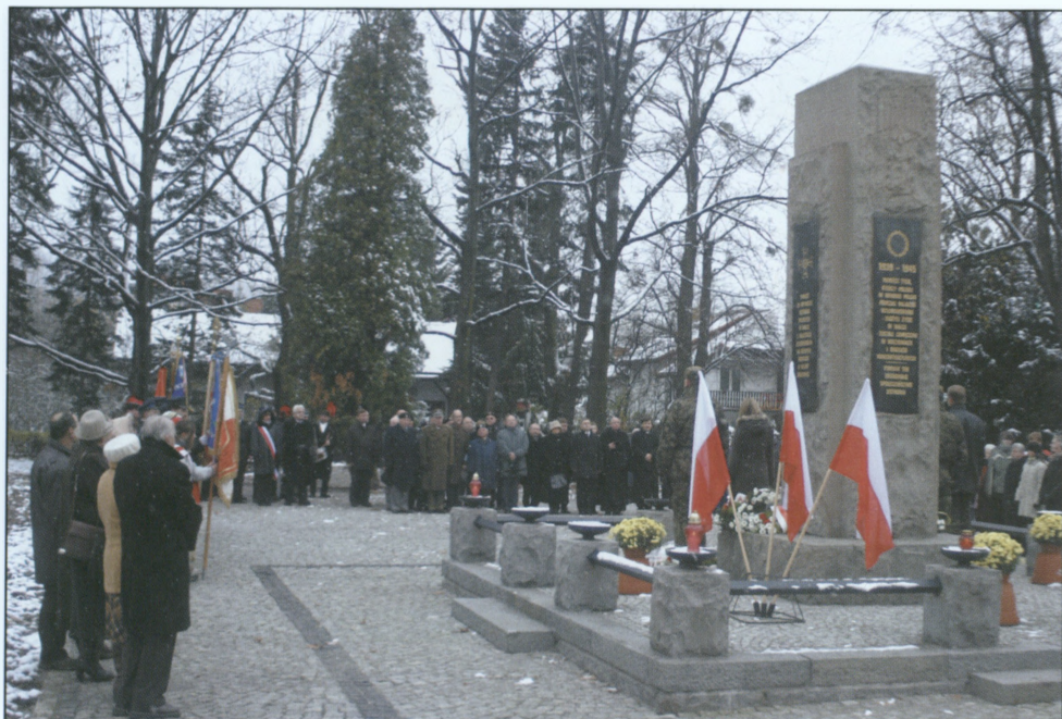
Obchody Święta Niepodległości przy pomniku Pamięci Narodowej – 11 listopada 2007 r.