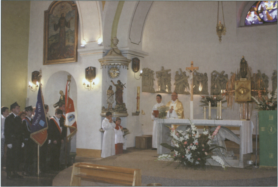
Uroczysta msza w kościele rzymskokatolickim pw. św. Klemensa w Dniu Wojska Polskiego – 15 sierpnia 2007 r.