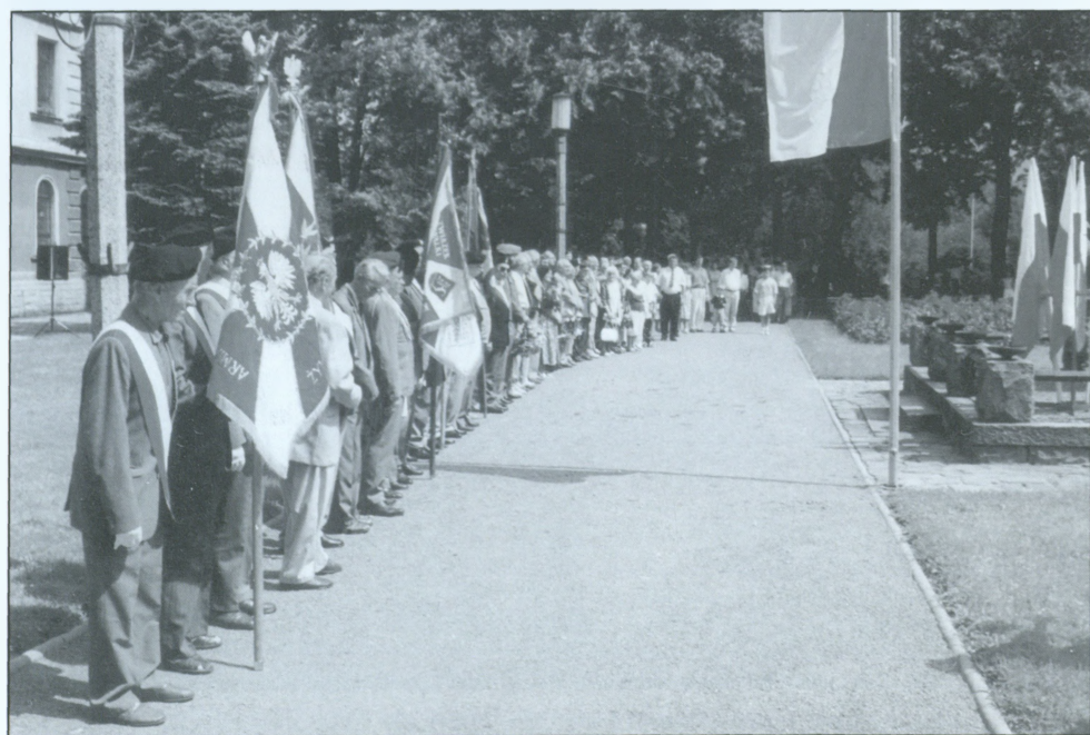
Poczty sztandarowe oraz inni oczekujący na rozpoczęcie ceremonii pod pomnikiem za ratuszem.