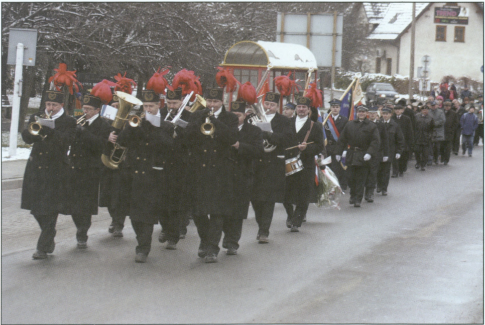
Orkiestra dęta Kopalni Węgla Kamiennego „Pniówek” na czele pochodu udającego się z kościoła ewangelickiego pod pomnik za ratuszem – 11 listopada 2007 r.