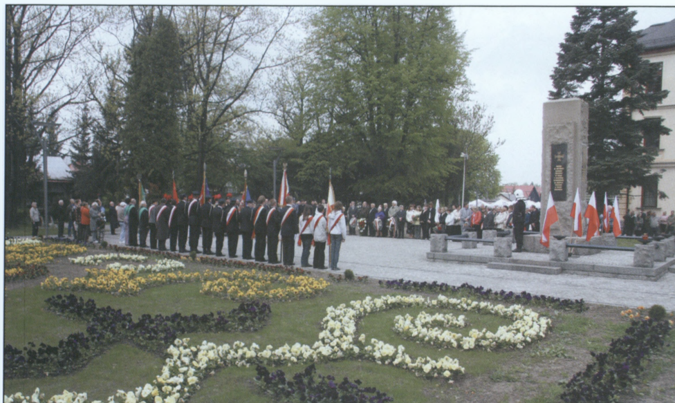
Uroczystości trzeciomajowe pod pomnikiem Pamięci Narodowej – 2008 r.