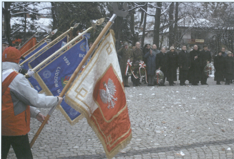
Prezentacja sztandarów – 11 listopada 2007 r.