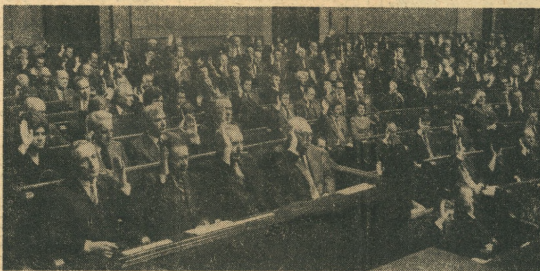
(A) Podczas obrad

Następnie Sejm jednogłośnie powziął uchwałę w związku z