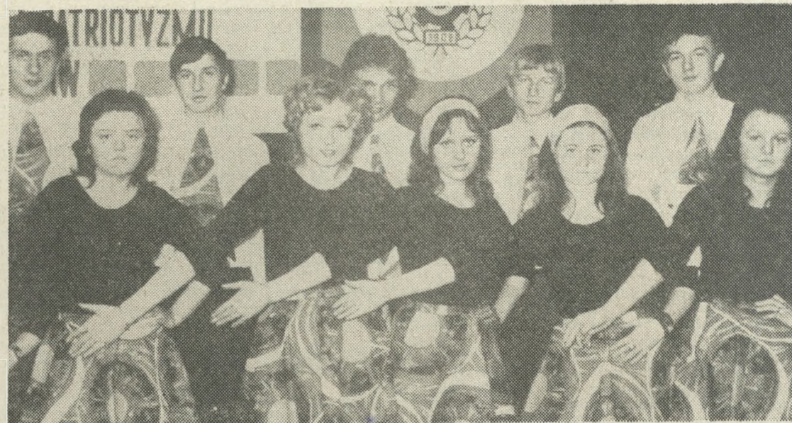
Zespół taneczny Zakładowego Domu Kultury „Kuźni” Ustroń