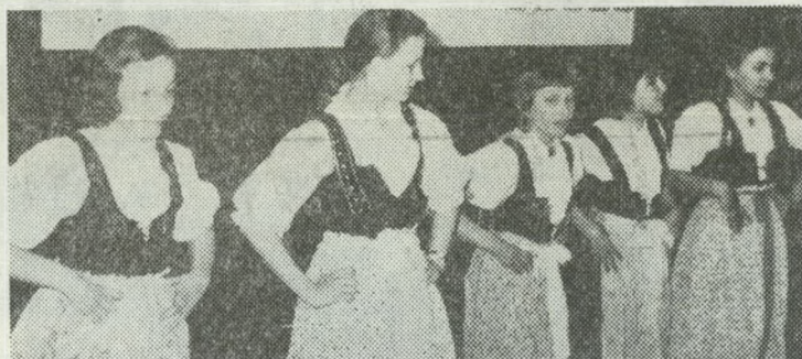
Dziewczęta w tańcu cieszyńskim.