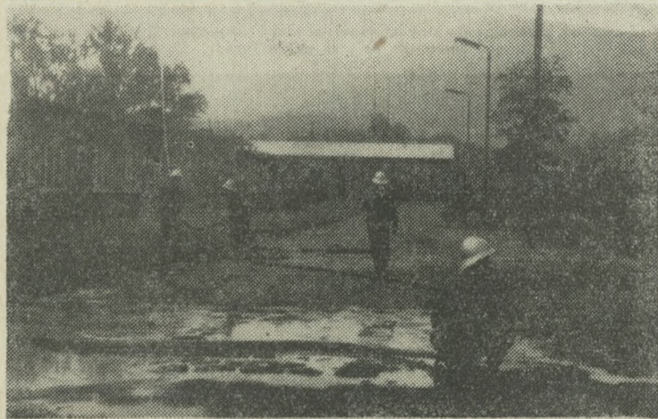
Zadanie: ugaszenie ognia drewnianego baraku na terenie zakładu.

Zwalczanie klęsk żywiołowych i praca społeczna na rzecz zakładu jest domeną aktywności strażaków. W 1973 roku członkowie Ochotniczej Straży Pożarnej Zakładu nr 3 przepracowali 1020 go