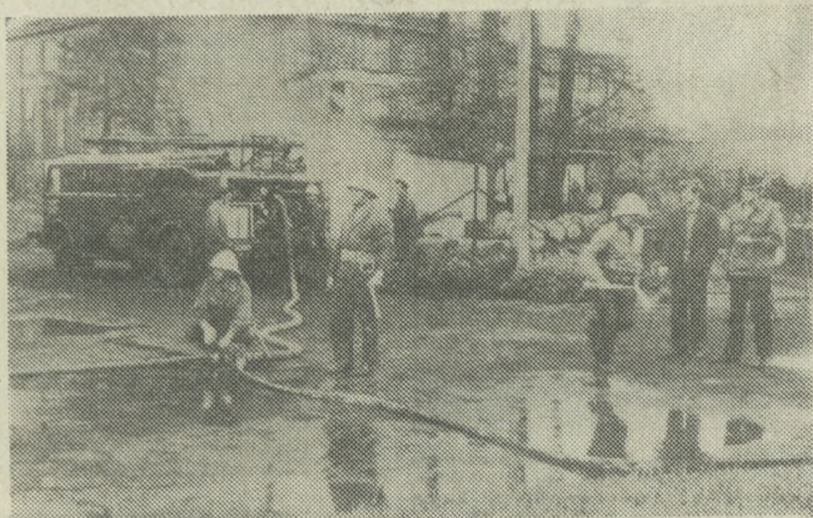
Strażacy OSP podczas próbnego alarmu. W kilka minut po alarmowej syrenie wszyscy stawili się pod remizę i następnie przystąpili do akcji bojowej.

Ważnym momentem w życiu tej jednostki strażackiej w okresie międzywojennym jest otrzymanie w 1928 roku pierwszego sztandaru z rąk dyrektora ówczesnej fabryki, który to sztandar dzisiaj jako zabytek muzealny, przetrwał okupację w warunkach konspiracyjnych.