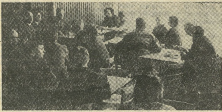
Na spotkaniu w ustroniańskiej kuźni przedstawiciele kierownictwa Zakładu nr 3 odpowiadali na pytania korespondentów „Sondy”, przekazując im doświadczenia zakładu.