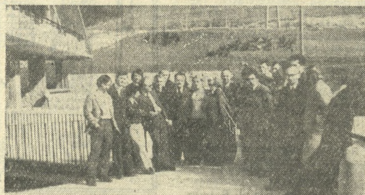
Uczestnicy szkolenia zwiedzili powstający w Ustroniu-Zawodzie kompleks nowoczesnych budynków wczasowych rozciągających przy okazji, dla czego nasza fabryka nie pomyślała o ośrodku wczasowym zlokalizowanym w tak pięknym regionie.