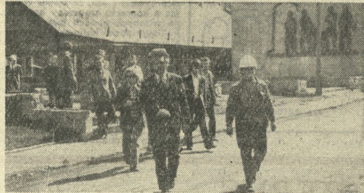
Zwiedzając Zakład nr 3 współpracownicy redakcji zainteresowali się szczególnie obiektami socjalnymi, mogącymi stanowić wzór dla innych zakładów fabryki.