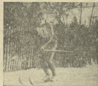
Jeden z biathlonistów, Andrzej Sobol