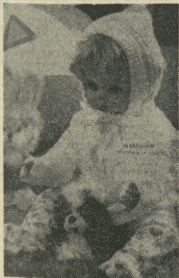
W Międzynarodowym Roku Dziecka na wystawie nie mogło zabraknąć wyrobów dla niemowląt i dzieci.

ni 12 godzin. Z początku były to „tłuste czwartki”, ale później doszły, tak samo „tłuste”, środy, piątki, wtorki. W Tłoczni Ciężkiej zdarzało się, że trzeba było pracować 5 dni pod rząd na wydłużonej zmianie. Fabryka nie mogła nie wykonać planu z powodu trudności w jednym wydziale... Rozumieli to, więc przystawali na propozycję dłuższej pracy. Niektórzy, zmęczeni 8-go-