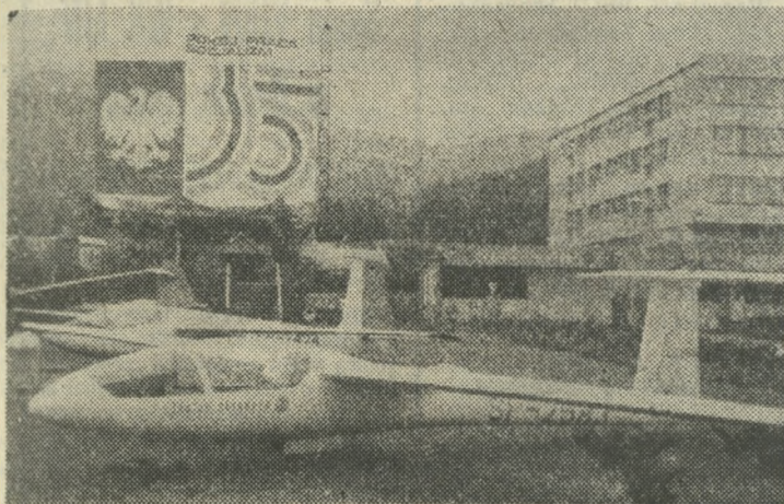
Fragment wystawy — na pierwszym planie produkowane w Bielsku-Białej szybowce, które cieszą się zbytem w całym świecie.

dziedzin życia gospodarczo-społecznego województwa bielskiego. Wystawa składa się z ekspozycji wprowadzającej, wskazującej na rolę i miejsce województwa w kraju oraz z ośmiu głównych ekspozycji tematycznych.