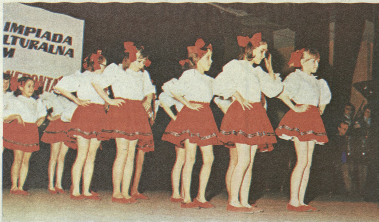
DZIECIĘCA GRUPA BALETOWA Z USTRONIA... I BIELSKA