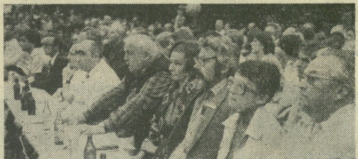
Jury konkursu w czasie przesłuchań.

Na uwagę zasługuje coraz większe zainteresowanie imprezą w Czechosłowacji. (o)