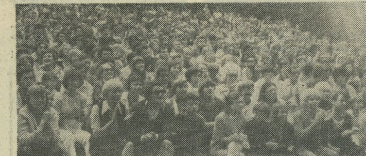
Wypełniona była po brzegi widownia ustronńskiego teatru.