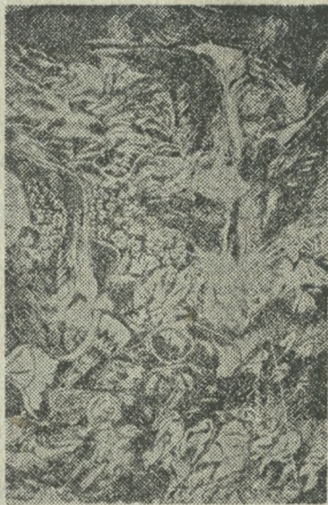
Apokalipsa XX wieku (drzeworyt sztorcowy) J. M. Smykowskiej.