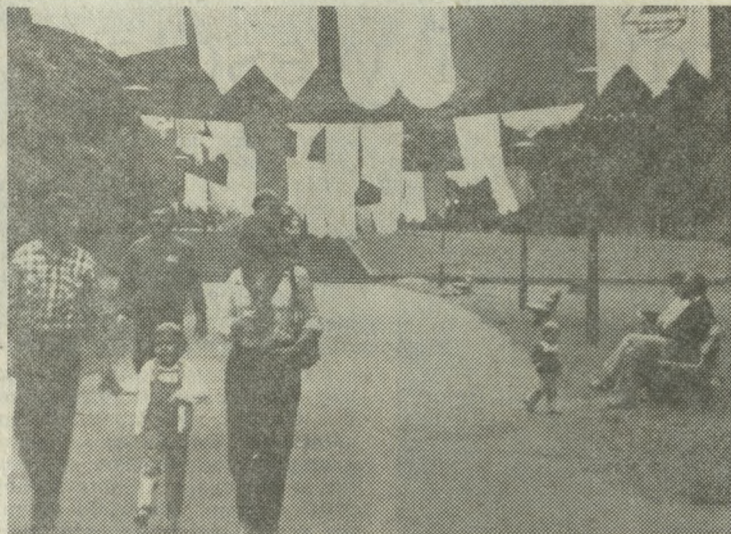
Pracownicy Zakładów FSM zlokalizowanych w Ustroniu i Skoczowie całymi rodzinami podążają na V Konkurs Piosenki Czeskiej i Słowackiej.

Koncert laureatów V Konkursu Piosenki Czeskiej i Słowackiej uświetniły występy znanych i lubianych artystów zawodowych wśród których byli: Karel Zich , Tibor Lensky , orkiestra Gustawa Bruma i zespół „Familia”, Renata Danel , Hanna Banaszak , siostry Maria i Barbara Winiarskie , znakomity zespół „Mortales” i inni.