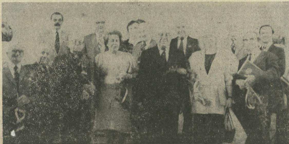
Pamiątkowa fotografia laureatów konkursu na wspomnienia „Mój Wrzesień 1939”.

(A) KATOWICE (Inf. wł.). Kiedy przed kilkoma miesiącami Śląski Instytut Naukowy w Katowicach wspólnie z Dziennikiem Zachodnim wysunęły pomysł zorganizowania konkursu na wspomnienia „Mój wrzesień 1939” towarzyszyły nam i uczucia nadziei, i pełne obawy.