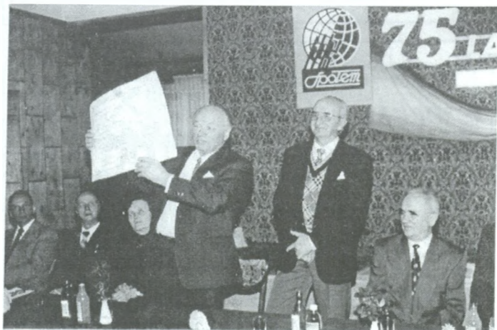
Dyplom od władz miasta.