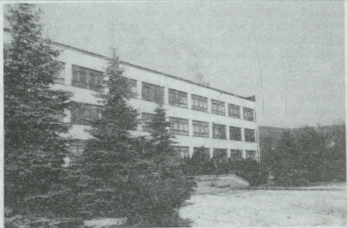
Jubilatka — Tysiąclatka.