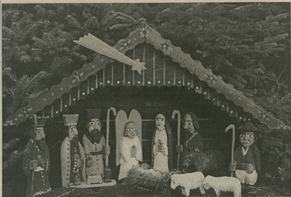
"Jasełka góralskie" A. Szpyrca, malowane na szkłe (1995)