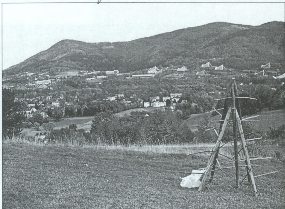
Ustron z podrównicką dzielnicą leczniczo-wypoczynkową — Zawodzie.