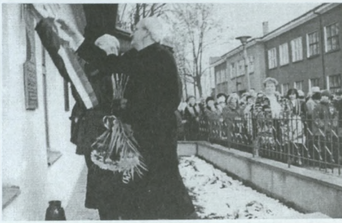
Moment odsłonięcia tablicy pamiątkowej.