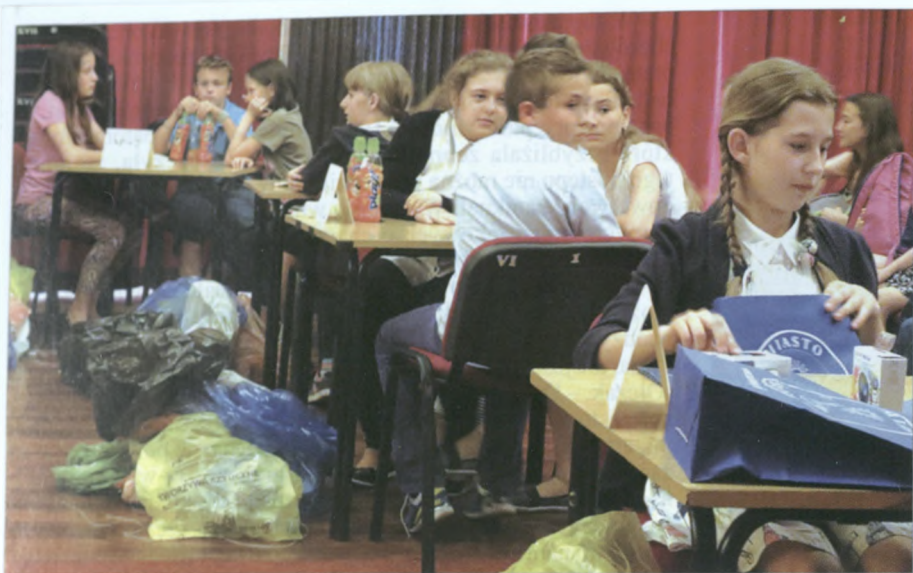
Uczniowie odpowiadali na testowe pytania i segregowali odpady.