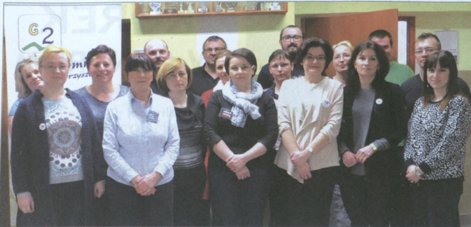
Strajkowali m.in. pracownicy G-2...