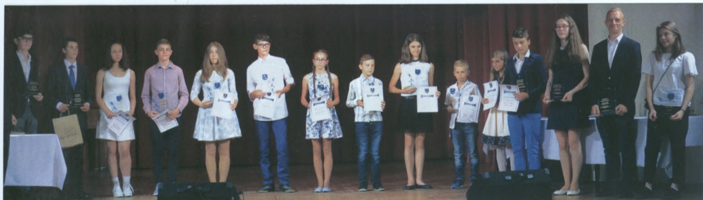
„They are the champions” - można powiedzieć, parafrazując utwór, który zabrzmiał dla najlepszych sportowców i absolwentów.