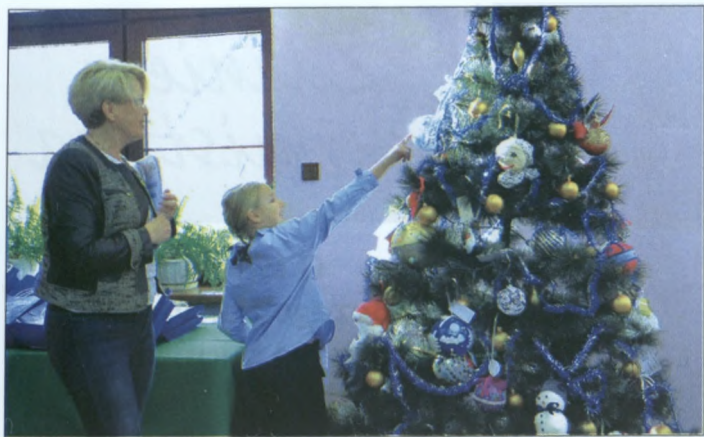
Dzieci pokazywały swoje bombki...