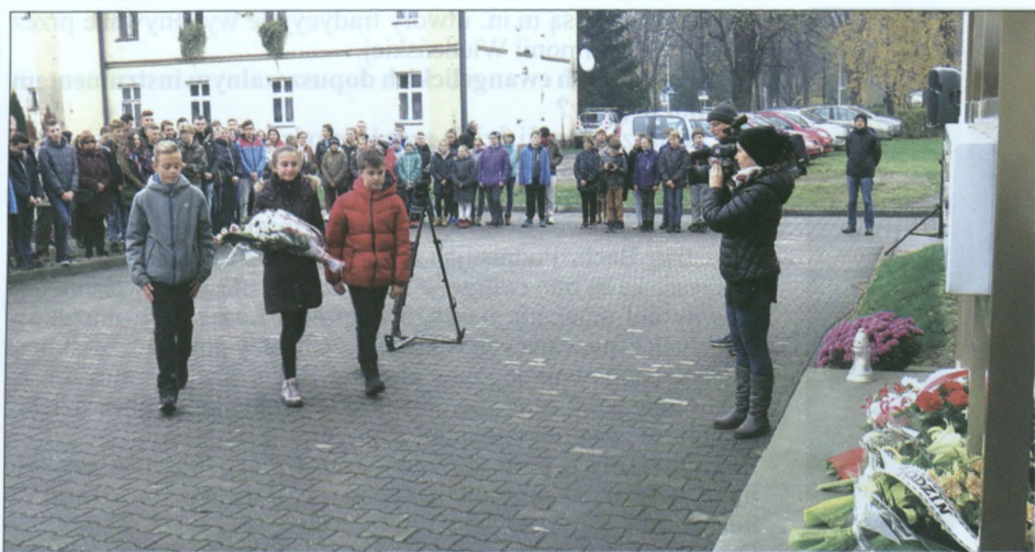
Uczniowie składają kwiaty przy G-1, pod tablicami upamiętniającymi rozstrzelanych ustroniaków.