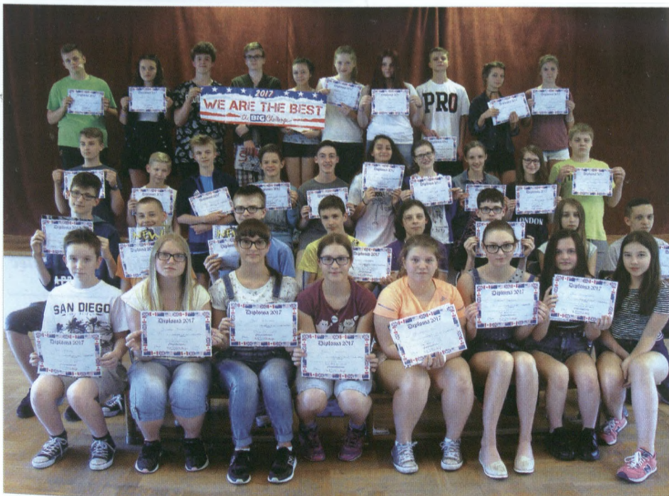
Najlepsi angielscy z Gimnazjum nr 1.