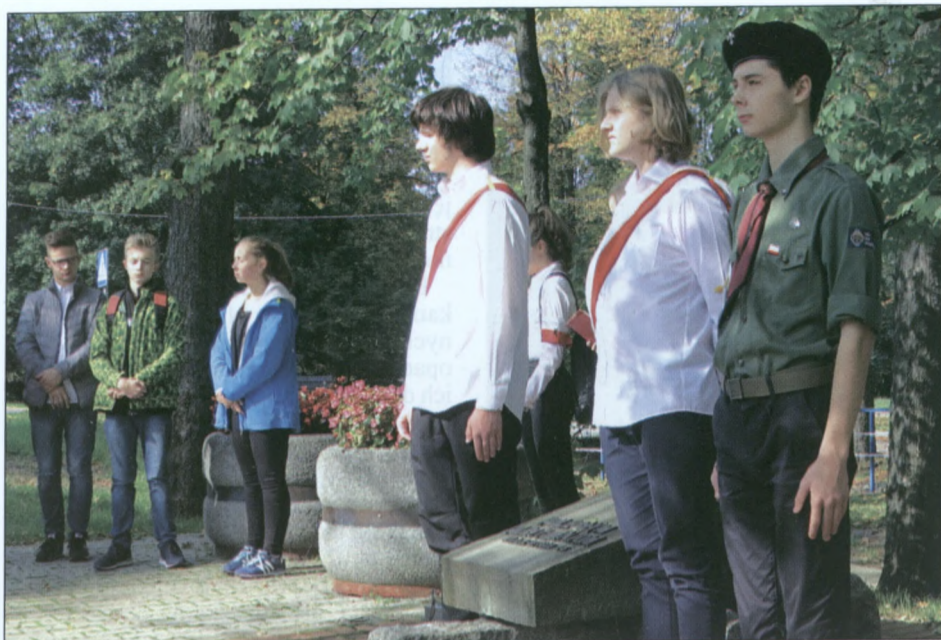
Uczniowie i harcerze pełnili wartę przy pomnikach.