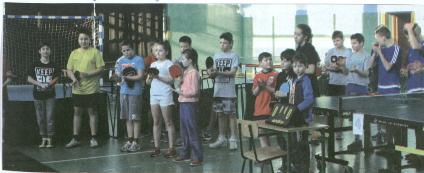
Odprowadza młodych zawodników.

W kategorii chłopcy gimnazja najlepiej zagrał 1. Kacper Nowak G1 2. Kacper Pawlitko G1 3. Jakub Bryjak G1