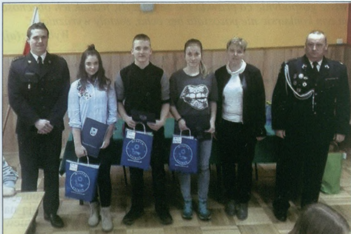
Laureaci w kat. szkół podstawowych i gimnazjów.