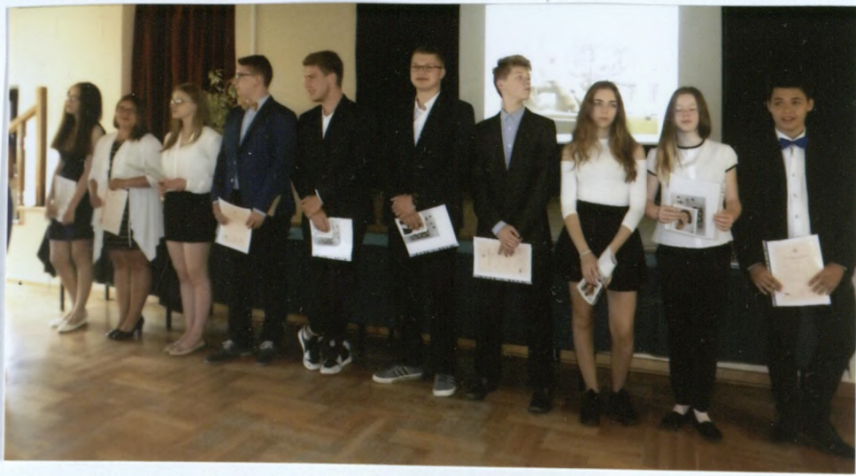
Kl. 3c z wyróżnieniem: