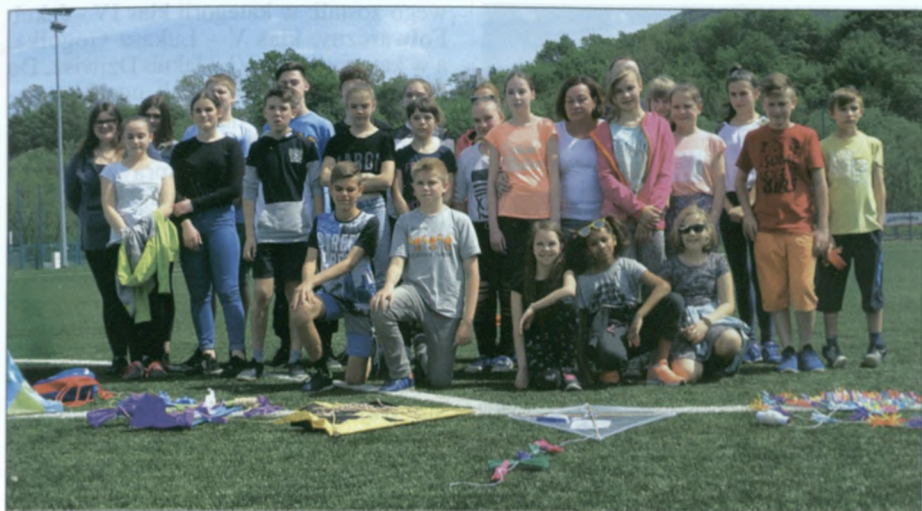
Wszyscy uczestnicy Miejskich Zawodów Latawcowych 2017.