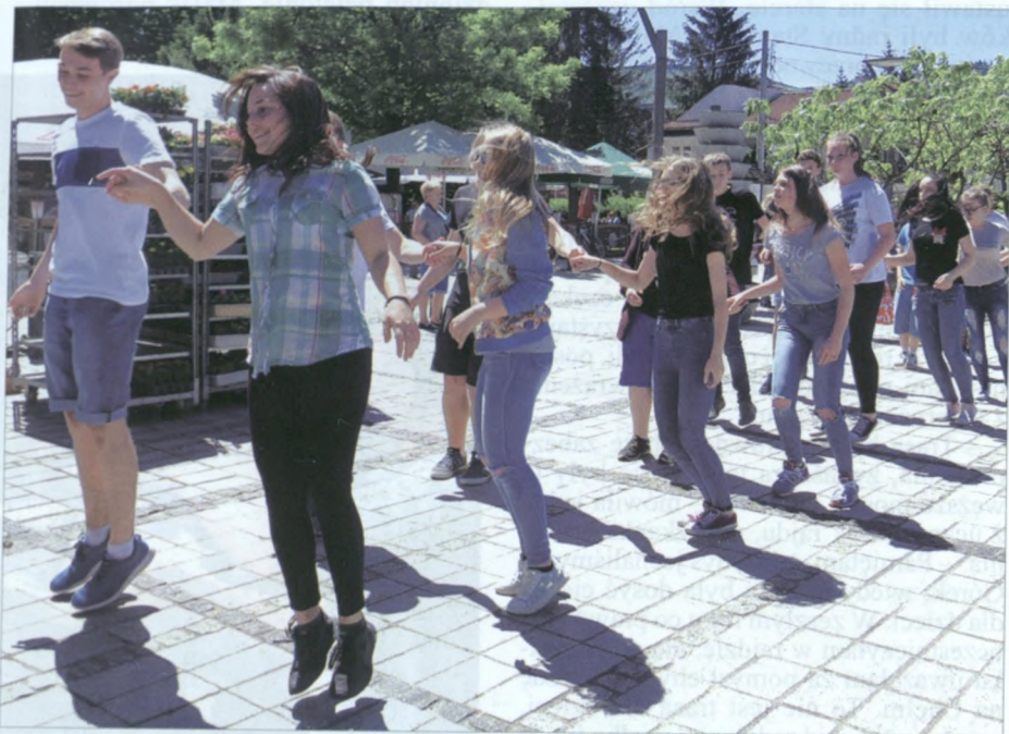
W zeszłym roku tańczyła tylko „Jedynka”, a teraz bawiły się oba gimnazja.

1 czerwca na ustrońskim rynku zrobiło się gwarno i radośnie. To gimnazjaliści przybyli, aby wspólnie zatańczyć popularną „Belgijkę” zespołu Laïs. Taniec ten zyskał sobie wielu sympatyków, jest obecny podczas zabaw weselnych, karnawałowych czy domówek. Jakże więc mogłoby go zabraknąć w centrum Ustronia? Punktualnie o 12.00 rozbrzmiała skoczna muzyka, a młodzież tańczyła w jej takt śmiejąc się i kibicując sobie nawzajem. Po zakończeniu wszyscy wołali: „Chcemy jeszcze raz!”. Mimo skoczego rytmu młodzież nie odczuła dużego zmęczenia i skakała belgijski taniec wokół rynku po raz drugi. Gdy ostatnie brzmienia muzyki dobiegły końca, wszyscy powrócili do swoich szkół wraz z nauczycielami. (aj)