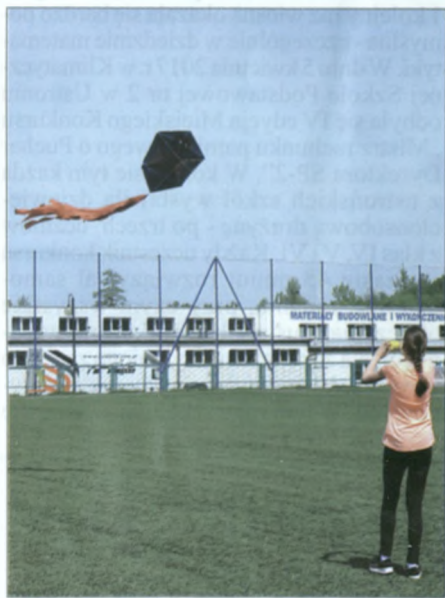
Ten latawiec, podobnie jak kilka innych, poczuł wiatr w... ognie.