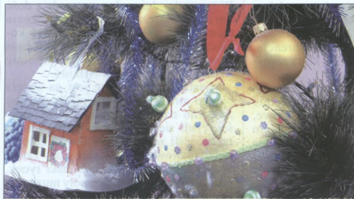
... które były różnych kształtów.