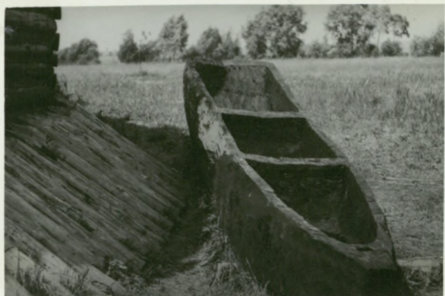
W Biskupinie :