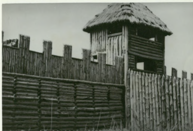
Widoczne ostrokoły i częstokoły.