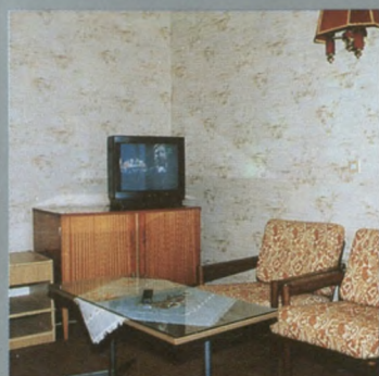
Pokój dzienny Tageszimmer