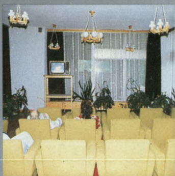
Sala klubowa Klubsaal

Ośrodek prowadzi działalność typową dla obiektów wypoczynkowych i sanatoryjnych.