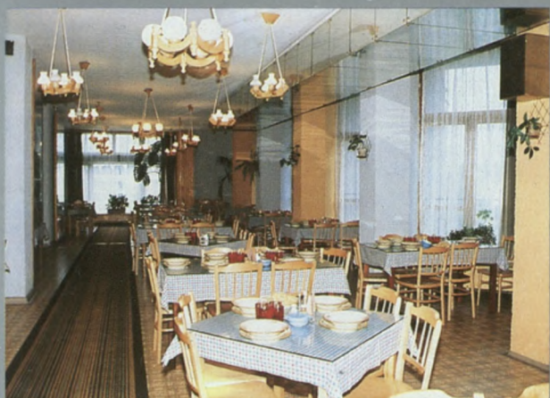
Sala jadalna Essesaal