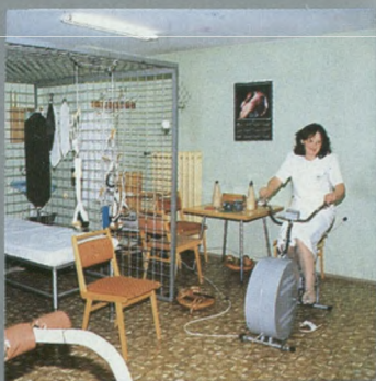
Rehabilitacja ruchowa Bewegungsrehabilitierung

Dom Wczasowo-Lecznicy „Malwa” jest czynny przez cały rok.