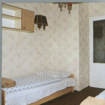
Pokój syplalny Schlafezimmer