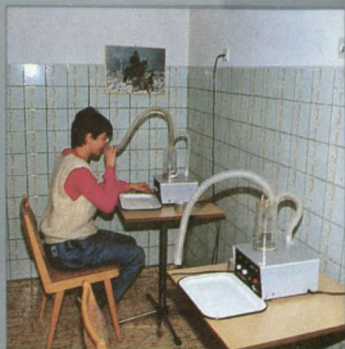
Gabinet Inhalacji Inhalationsraum