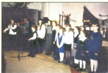
Chór dziecięcy TKA