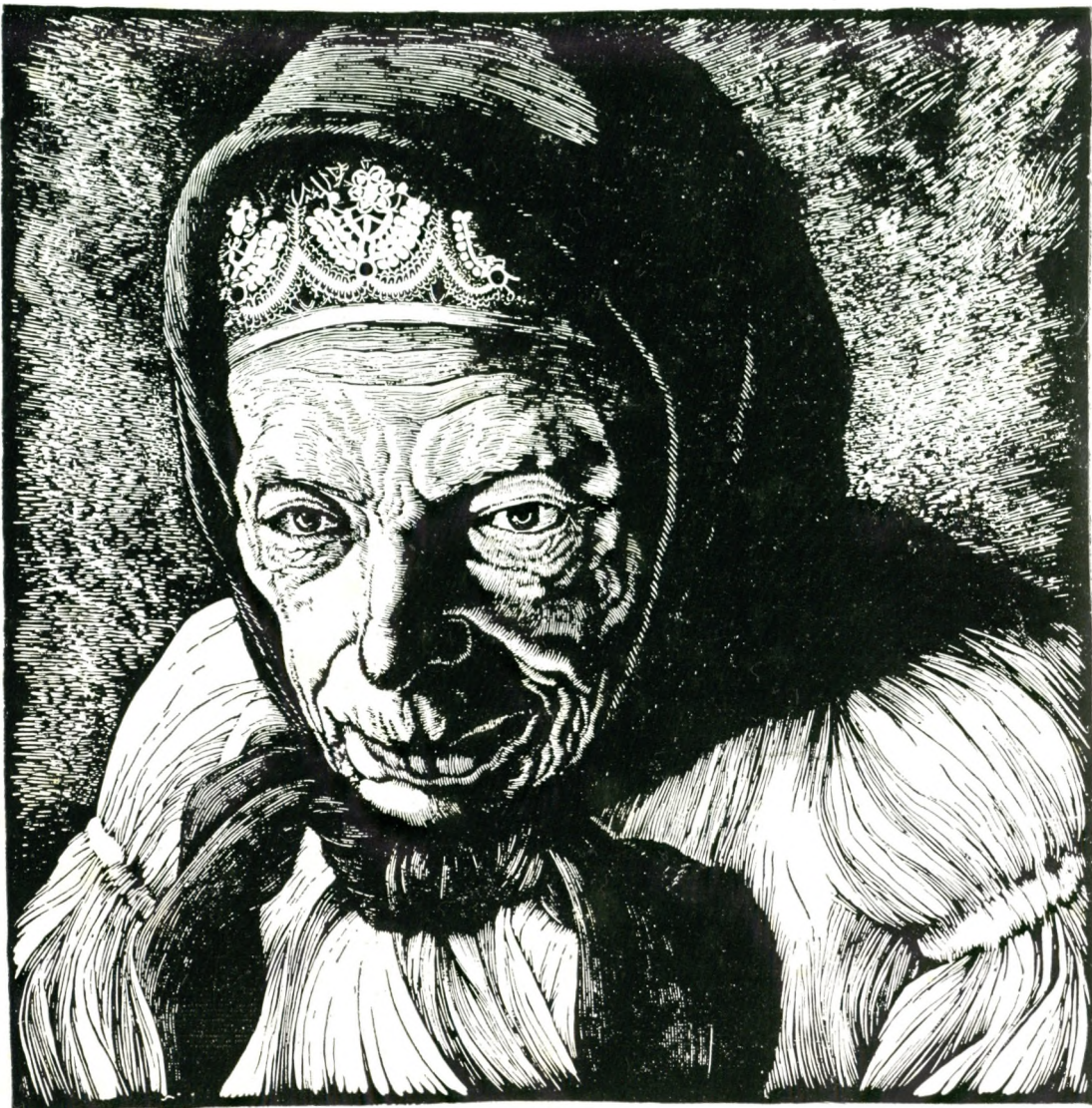
Góralka z Istebnej – drzeworyt (1933) oryg 32×31 cm