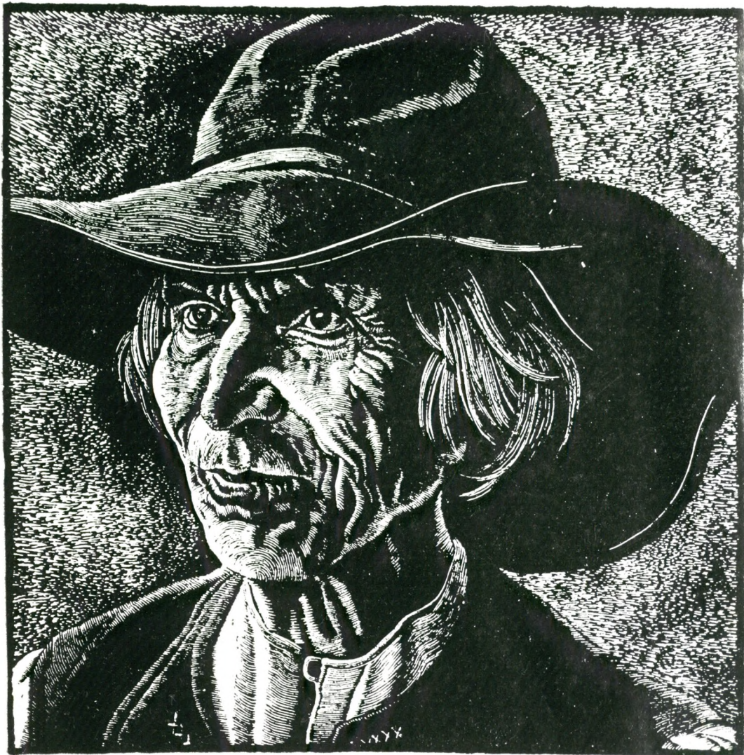
OWCZARZ Z BARANIEJ (repr. drzeworytu)