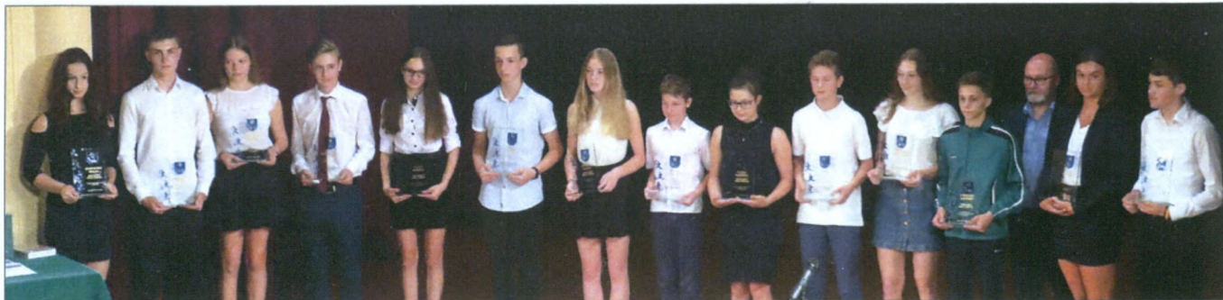
Najlepsi sportowcy w mieście, każdą szkołę reprezentuje uczennica i uczeń.