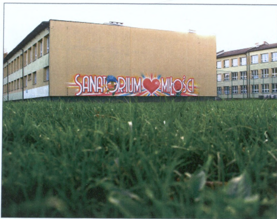
Obecność Ustronia w ogólnopolskiej telewizji to reklama naszego uzdrowiska na wielką skalę bez nakładów finansowych z miejskiej kasy. Mural można też potraktować jako początek artystycznego zagospodarowania pustej ściany.