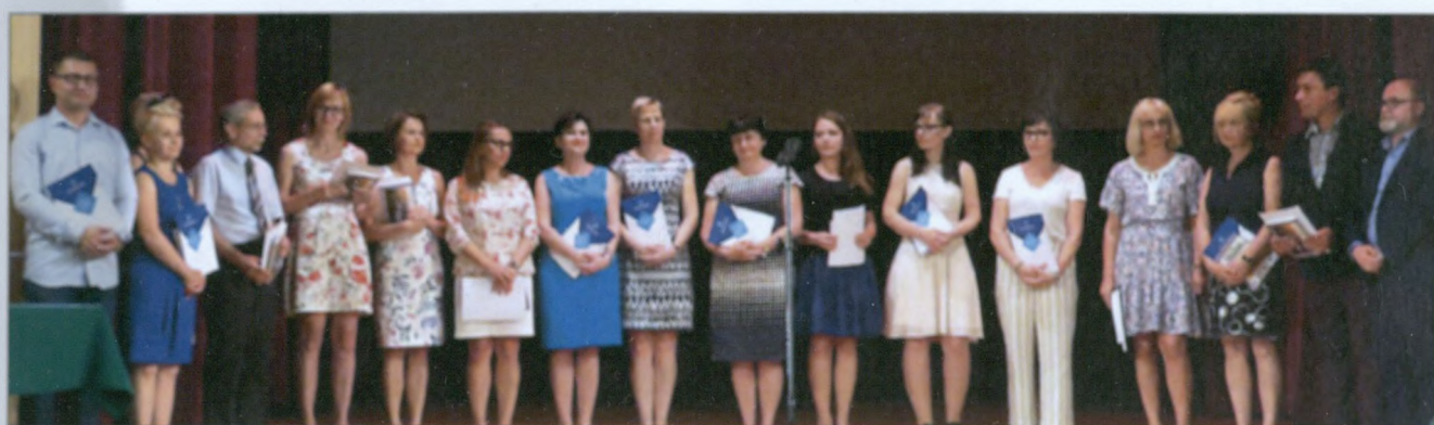
Nauczyciele i opiekunowie wyróżnionych uczniów szkół podstawowych.