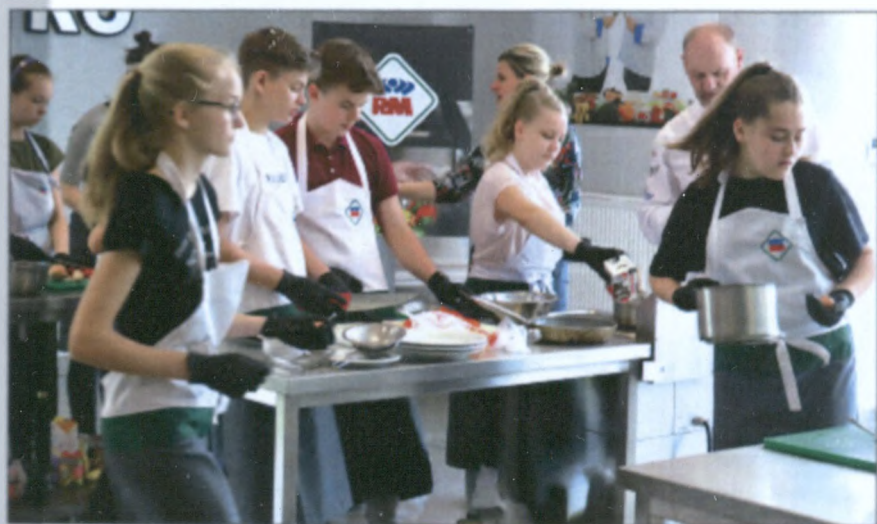
Uczniowie 7 i 8 klas z zaangażowaniem przystąpili do konkursowej rywalizacji.