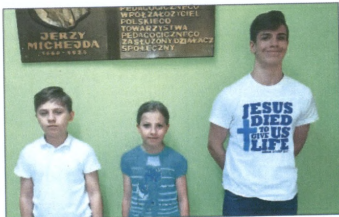
Uczniowie ze Szkoły Podstawowej nr 2 w Ustroniu.