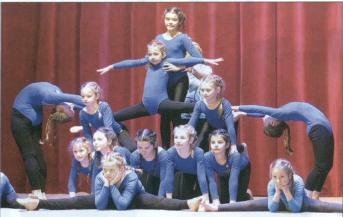
Ci nieco starsi dzielili się swoim talentem w gimnastyce artystycznej. Na zdjęciu „GumoMocne Espriciaki”.