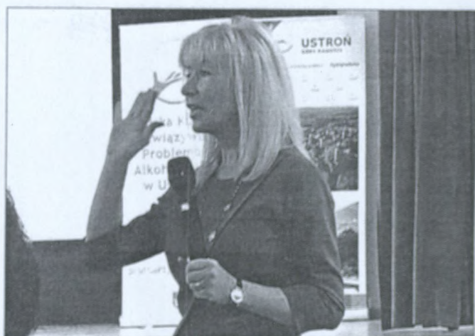
Dura lex, sed lex - twarde prawo, ale prawo.

z dziećmi w przedszkolach, uczniami szkół podstawowych i gimnazjów, ze starszą młodzieżą. Bardzo leży jej na sercu dobro dzieci, których problemy są skutkiem zaniedbań lub niewiedzy dorosłych. A zaniedbane dzieci to potencjalni oskarżeni.