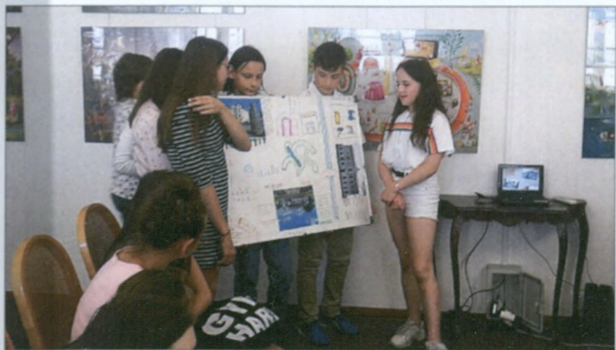
Zwycięska drużyna z SP-1 prezentuje swoją koncepcję zagospodarowania rynku.