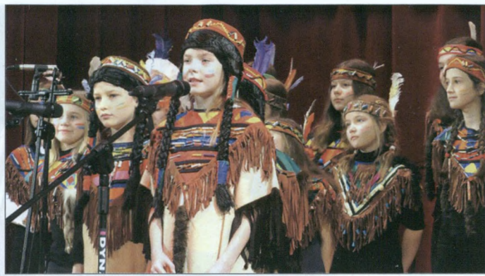
Nie zabrakło także zespołów wokalo-instrumentalnych, takich jak „Wiolinki”.