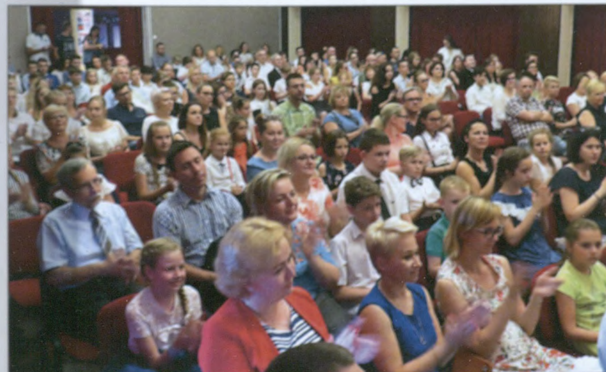
Z osiągnięć uczniów dumni byli nauczyciele i bliscy.