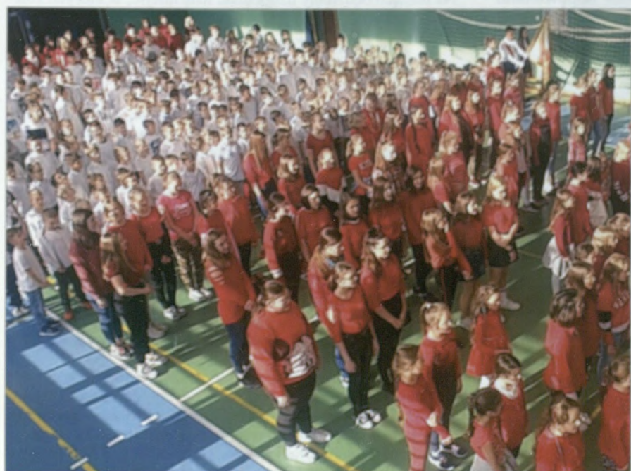
Piątek, godz. 11.11, uczniowie Klimatycznej Szkoły Podstawowej nr 2 śpiewają hymn, by uczcić 101. rocznicę odzyskania niepodległości przez Polskę.