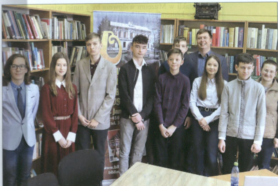
Debatę na temat internetu prowadzili uczniowie SP-6 i SP-1...