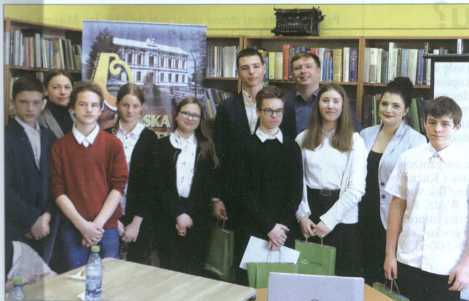
... a o ekologię spierali się reprezentanci SP-3 i SP-2.