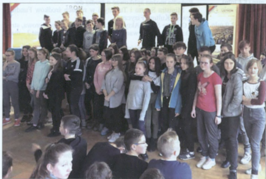
W piątek 22 marca w Ustroniu gościła sędzia Anna Maria Wesółowska. Nie przyjechała do nas jako gwiazda telewizyjna, ale jako osoba, która od kilkudziesięciu lat zajmuje się prawem. Obecnie głównie propagowaniem i tłumaczeniem jego litery dzieciom, młodzieży i dorosłym. Więcej na str. 10.