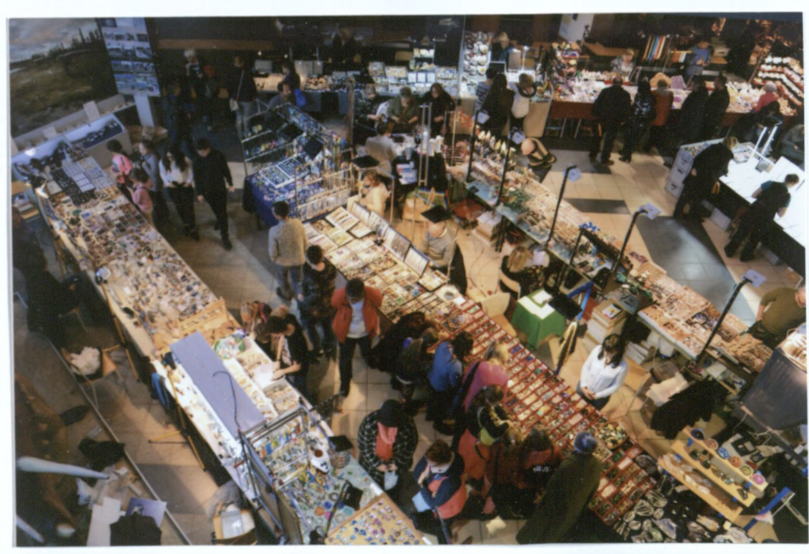
GIEŁDA MINERALÓW W SOSNOWCU