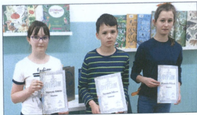
Uczniowie ze Szkoły Podstawowej nr 6 w Ustroniu.