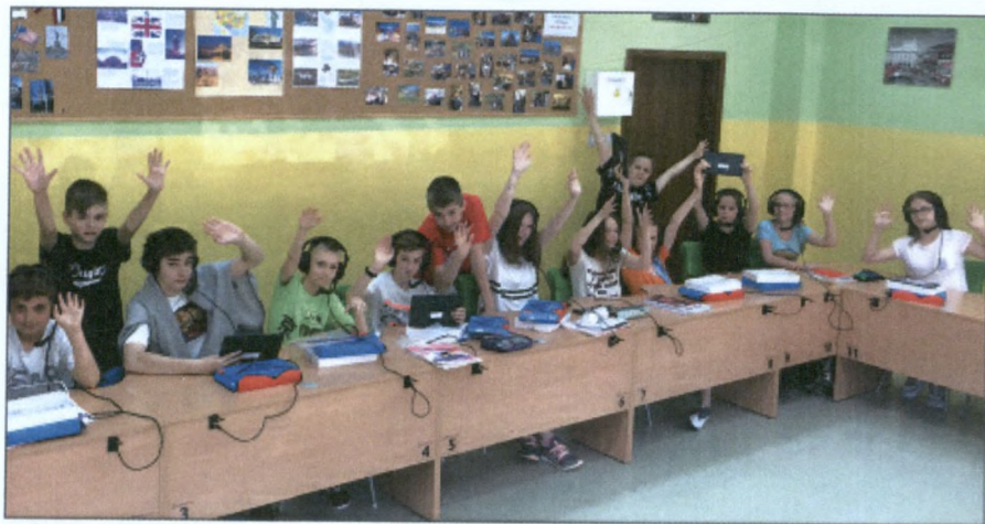
Klasa 6c podczas zajęć języka angielskiego.