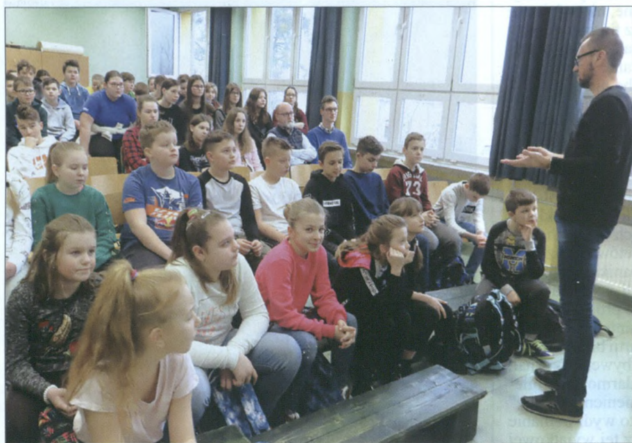
Program przeciw hejtowi rozpoczął się w Szkole Podstawowej nr 2.