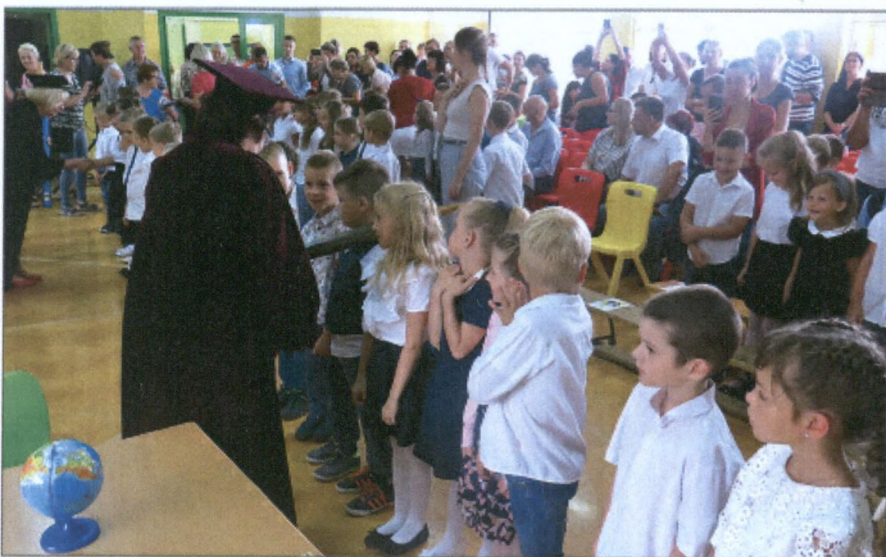
Pasowanie pierwszaków w SP-2.