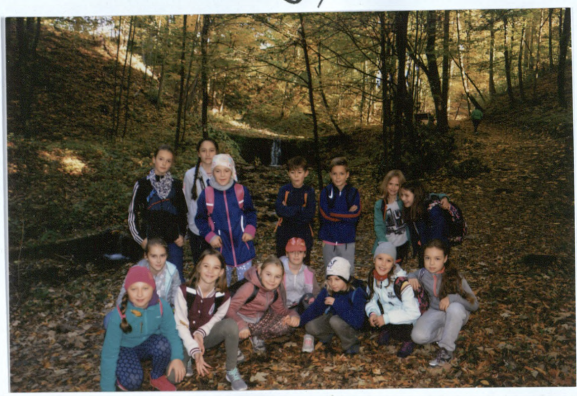
RAJD SZLAKIEM „ZRODLANYM”