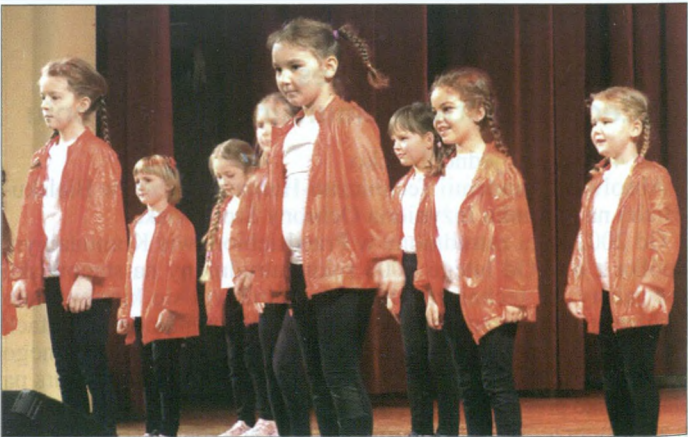
Nie zabrakło oczywiście tańca. Swoje zdolności pokazywały najmłodsze dzieci, m.in. zespół „Rytm”.