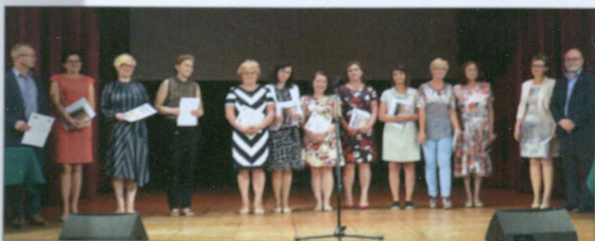
Po raz ostatni wyróżniono nauczycieli gimnazjów.