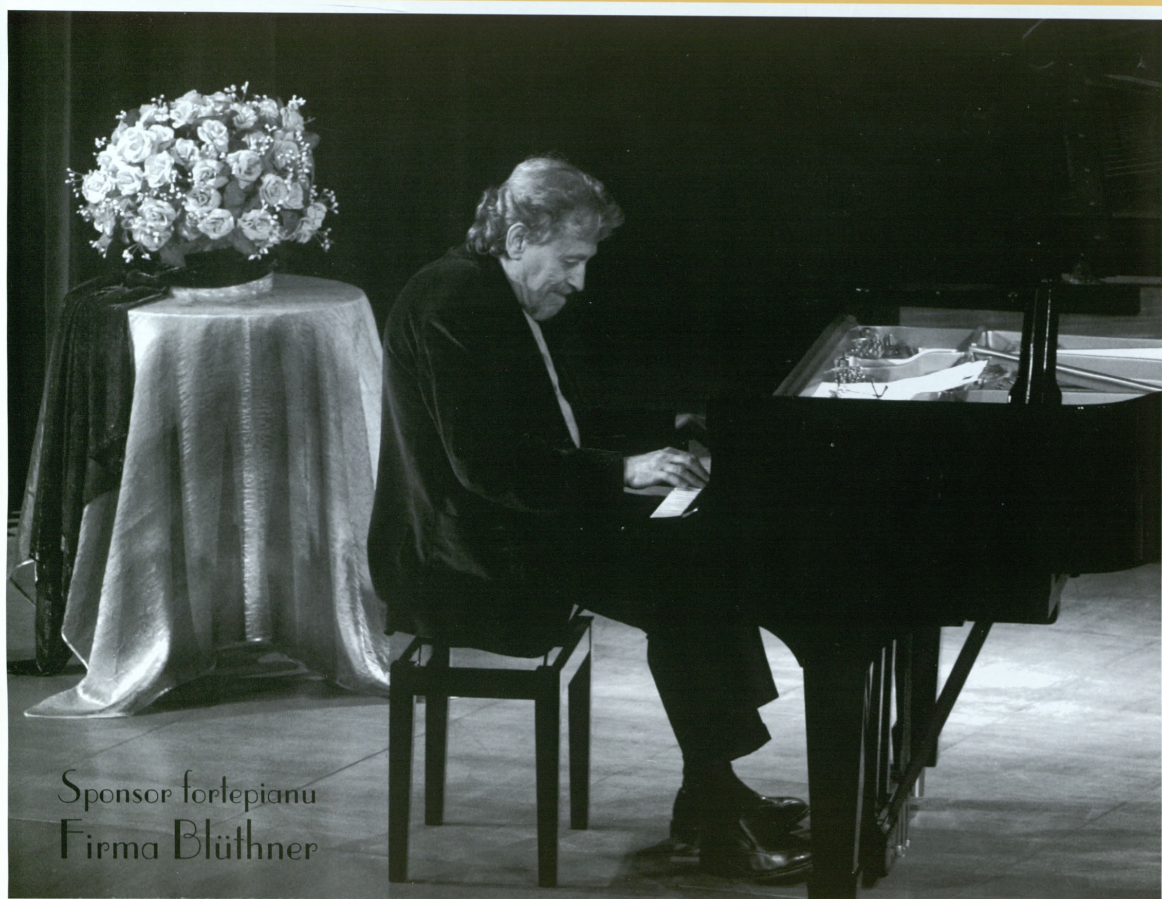
Sponsor fortepianu Firma Blüthner