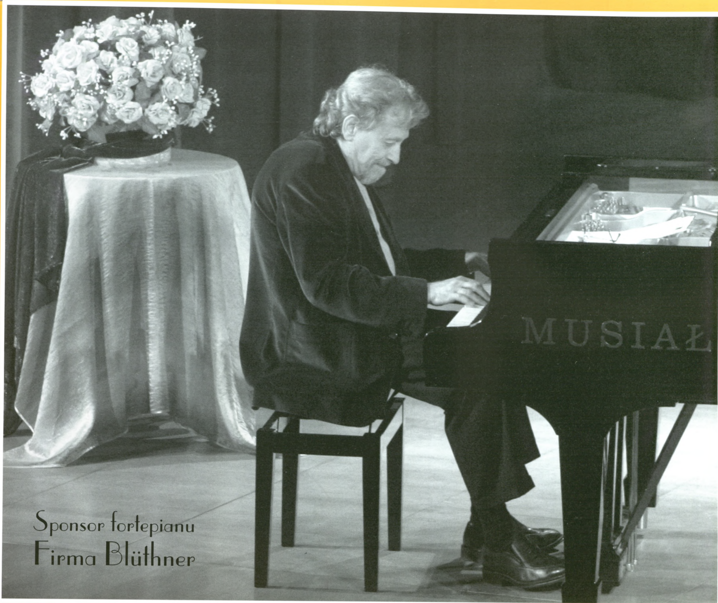
Sponsor fortepianu Firma Blüthner