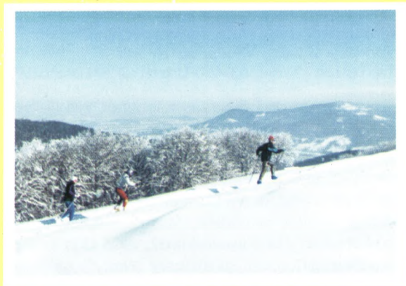
„Zima w Ustroniu”