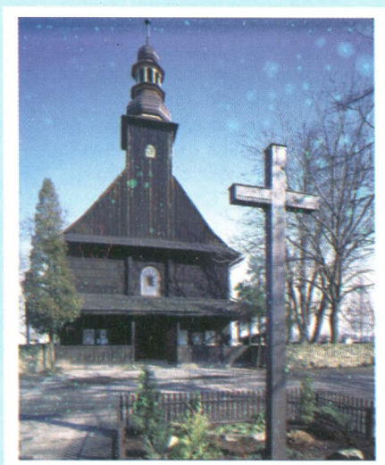
Kościółek w Nierodzimiu