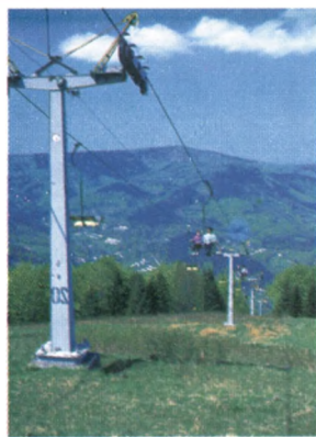
Kolej Linowa na Czantorię