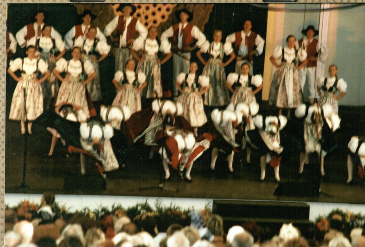
"Kotomajka". Dziewczyny uderzają energicznie warkoczami o podłogę.