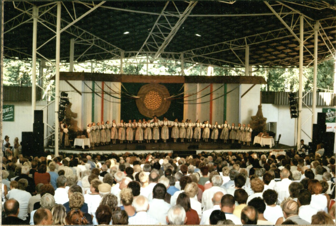
"Janiczek tronie siece"