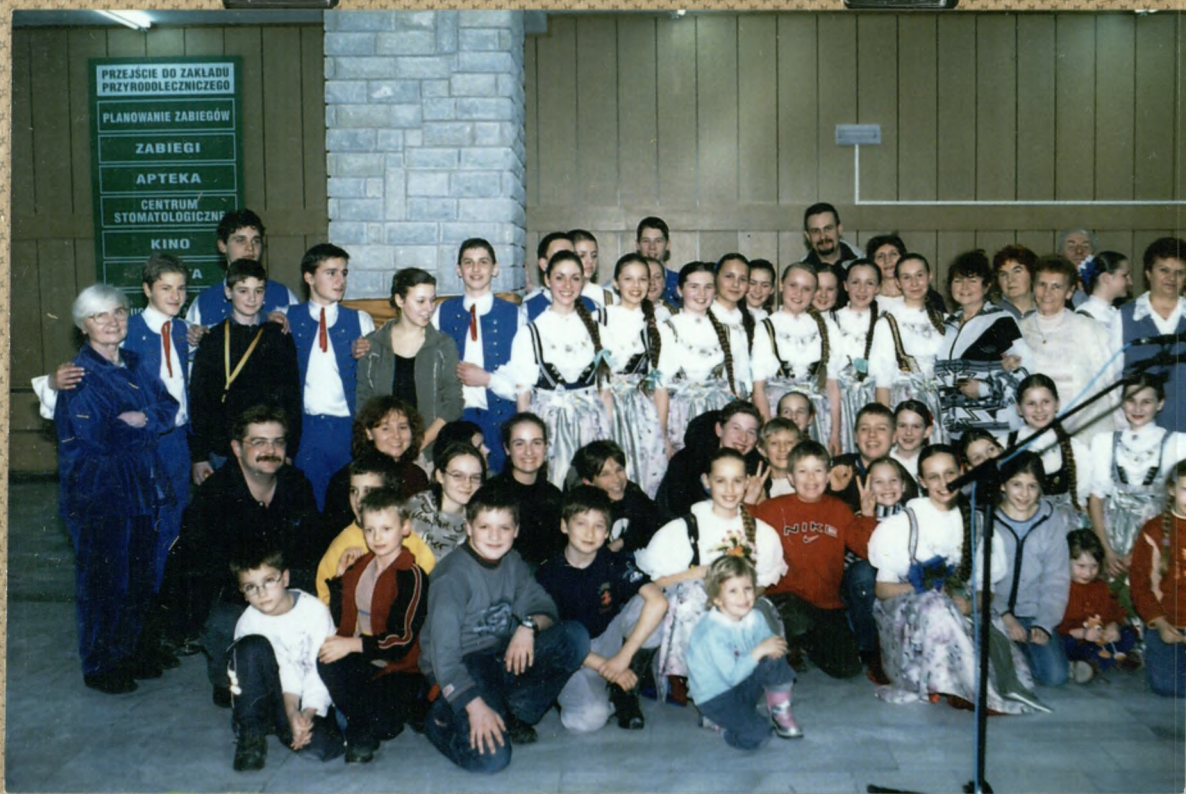
Koncert w Uzdolnosiska