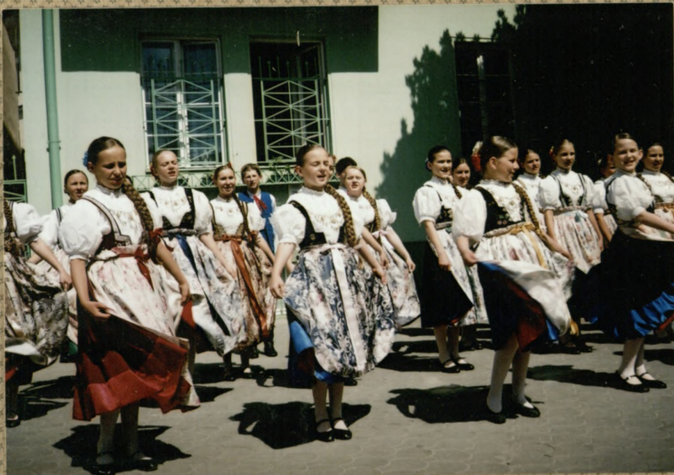
Koncert na deptaku - Piestany