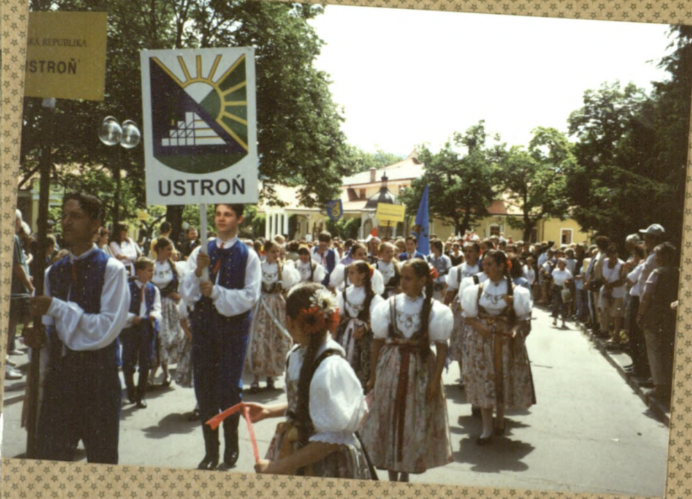
Korowód - Piestany