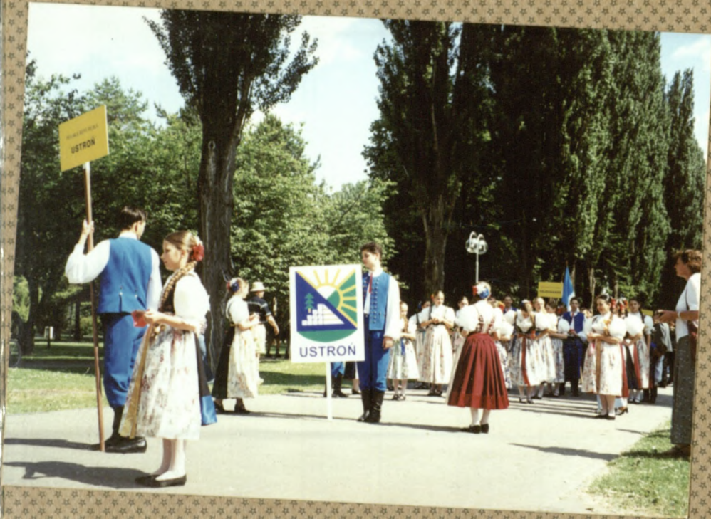
Korowód - Piestany