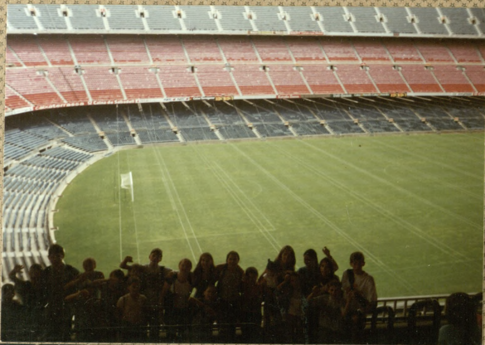
Hiszpania 2002 - Zespół na tle stadionu FC Barcelona