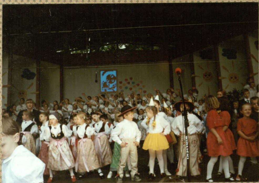
„Dzieci Dzieciom” 2002