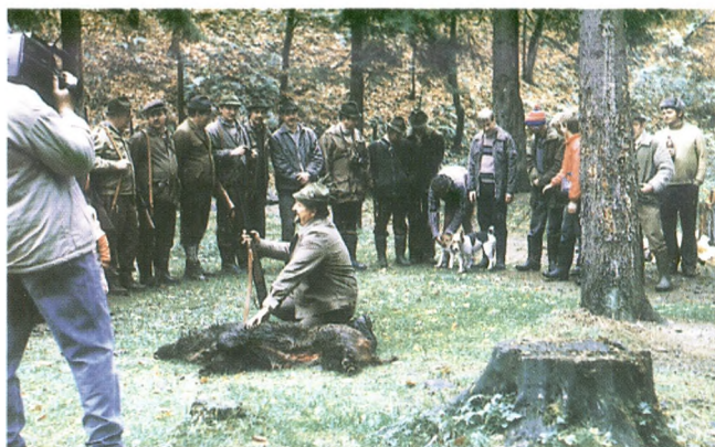
Pasowanie na dzikarza