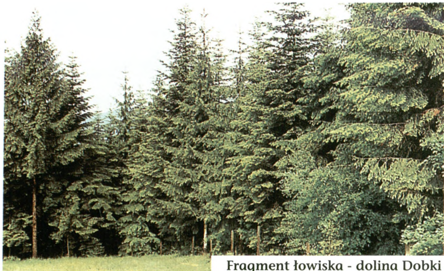
Fragment łowiska - dolina Dobki