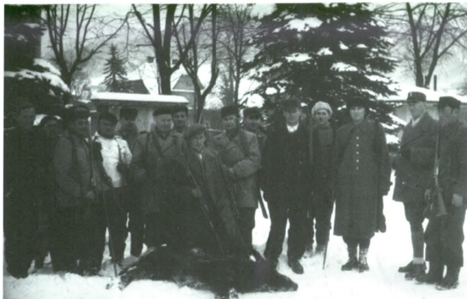
Jeden z pierwszych dzików upolowa- nych na terenie Ustronia Styczeń 1960 rok.

blerów” (widłaków). Odstrzał rogacza można było nabyć także w Nadleśnictwie.