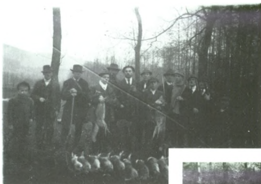
Pokot po polowaniu Lipowiec - 1992