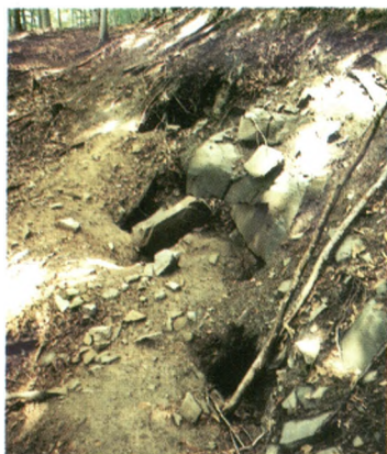
Borsucze nory w lesie pod Równicą