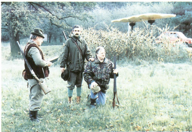
Ślubowanie myśliwego 1991r.

Koło Łowieckie w Ustroniu nazwę „Jelenica” przyjęło na zebraniu sprawozdawczo-wyborczym w dniu 3 maja 1980 roku nawiązując tym do nazwy, którą kiedyś nosiło. Koło gospodaruje na obwodzie łowieckim nr 46 z tym, że w obecnym kształcie granic od 1965 roku. Pracą koła kierują zarządy wybierane na zebraniach sprawoz-