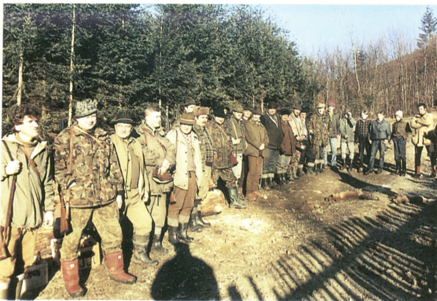
Po polowaniu Dobka 1994 rok.

Po wojnie myśliwi koła ustrońskiego posiadali broń starą, przeważnie dubeltówki - kurkówki produkcji przedwojennej, mocno zniszczone przez nieodpowiednie przechowywanie w czasie okupacji. Broń nowa była rzadkością. Czasami w sklepach pojawiała się broń pro-