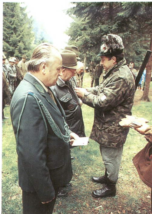
Uroczystość wręczania odznaczeń łowieckich 1993r.