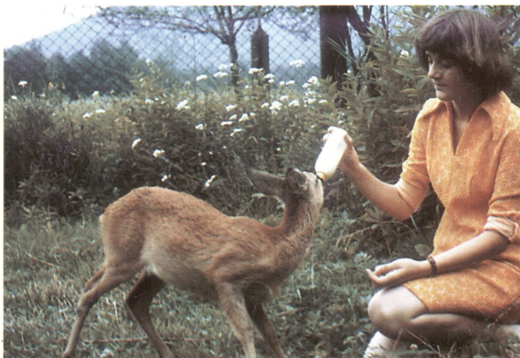
Opieka nad koźlęciem. (sierpień 1978 rok)

Dzików najwięcej pozyskano w rekordowym sezonie 1990/91 bo aż 38 sztuk. Najwięcej, 77 sztuk saren, pozyskano w sezonie 1986/87. Jak wykazuje przeprowadzona zimą bieżącego roku inwentaryzacja w obwodzie łowieckim dzierzawionym przez Koło Łowieckie „Jelenica”