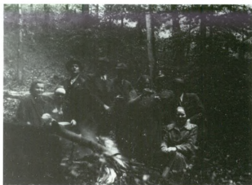
Obchody św. Huberta na Lipowskim lata trzydzieste

wanie szkód łowieckich wraz ze specjalnym przedstawicielem gminy. Ponadto odpowiedzialni byli za organizowanie polowań zbiorowych.