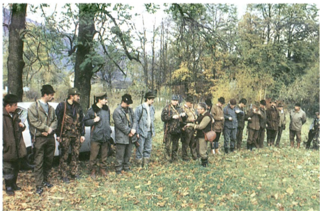
Zbiórka przed polowaniem. Rozdział stanowisk