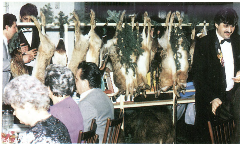
Bal myśliwski 1994 rok.

Należy także stwierdzić fakt całkowitego ustąpienia z terenu łowiska głuszca (w latach pięćdziesiątych) i jarząbka (lata siedemdziesiąte)