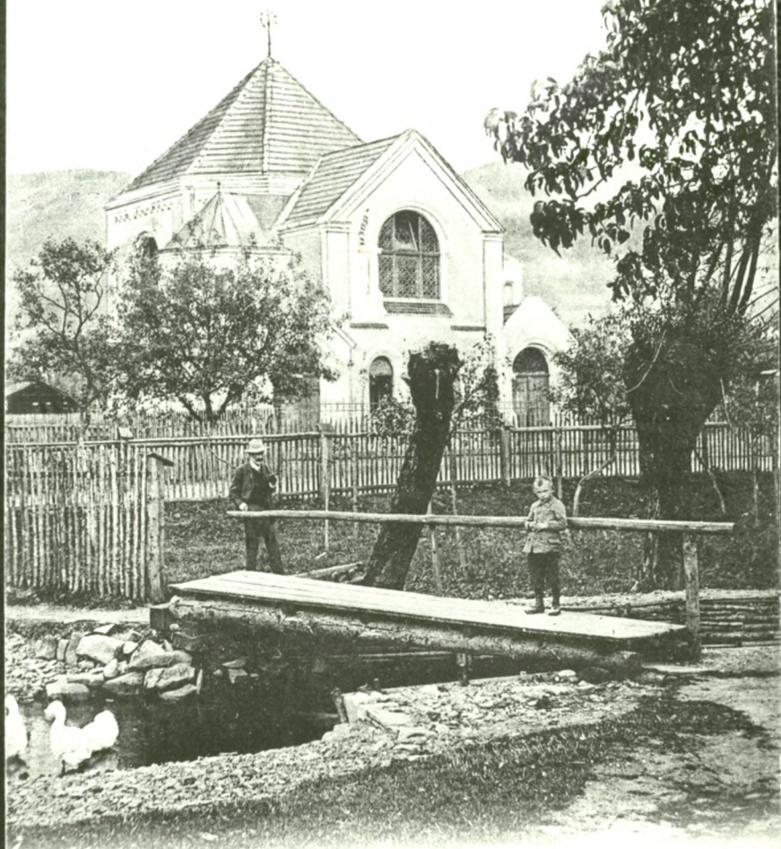
Ustron, oesterr. Schles.