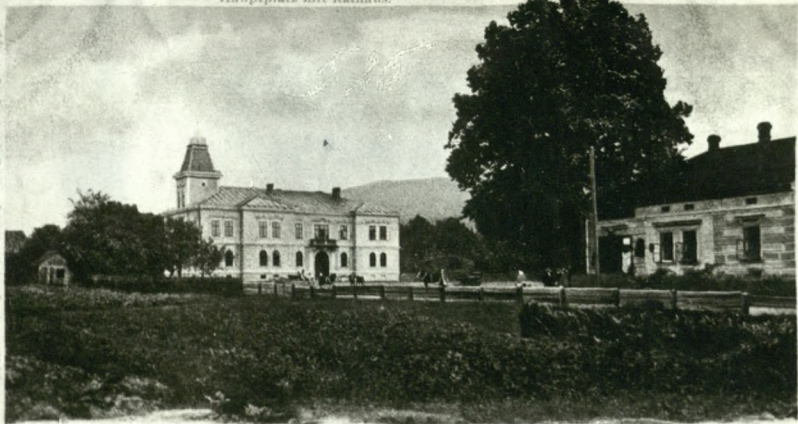
Ustron a. d. Weichsel, Moor- Schlamm- u. Wellenbad, ältest. Molkencur i. d. schles. Beskiden.