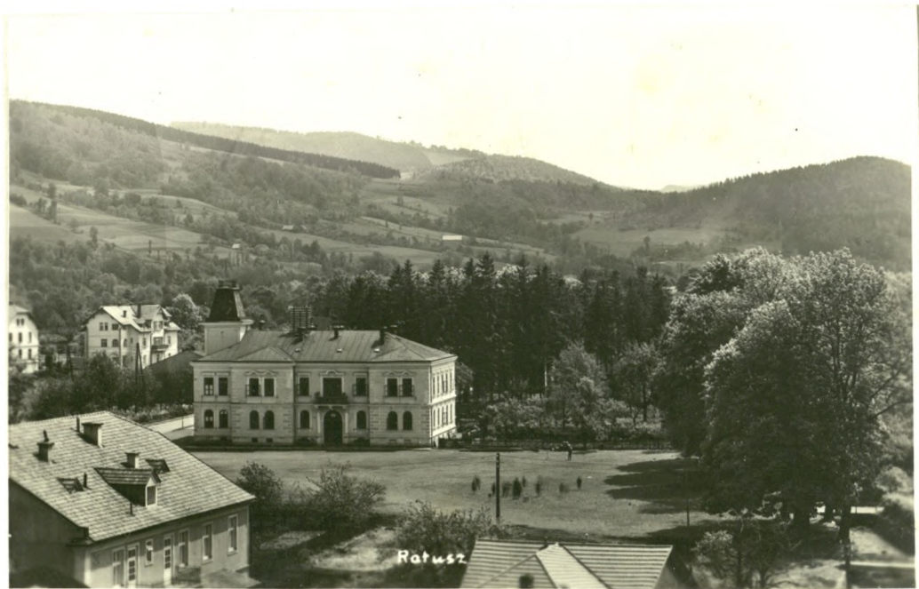
RATUSZ CIESZYN 1931