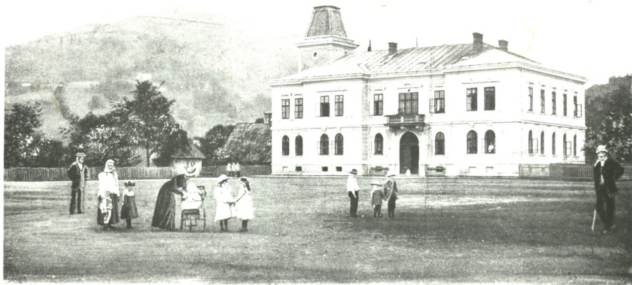
Bad Nauheim a. d. Weichsel. Moor, Schlamm u. Wellenbad, älteste Molkenkur i. d. schles. Bäder- u. Kur- Das Rathaus mit der Kowalew.