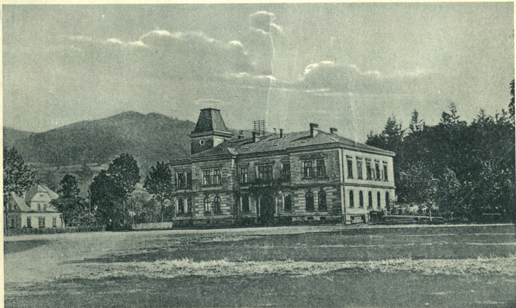
USTROŃ na Śląsku. Ratusz.