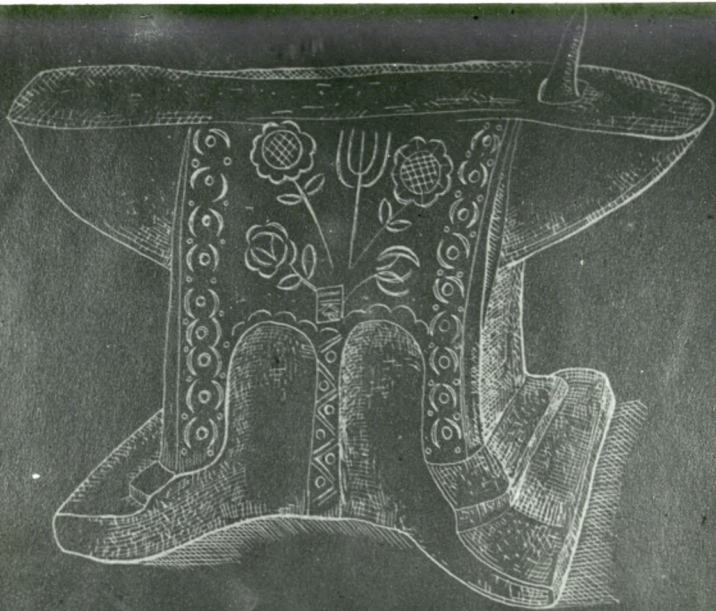
Ryc. 38. Kowadło z pocz. w. XIX. Ustroń.