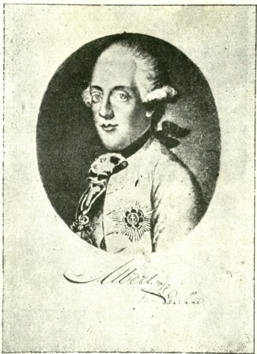
Albertus, Dux Saxoniae — Regius Princeps Poloniae.