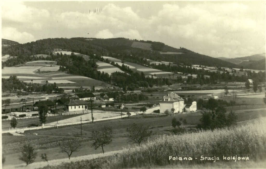
Polana - Stacja kolejowa