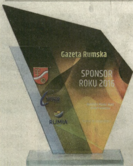
Podczas VIII Rumskiej Gali Sportu otrzymaliśmy nagrodę w kategorii Sponsor Roku 2016