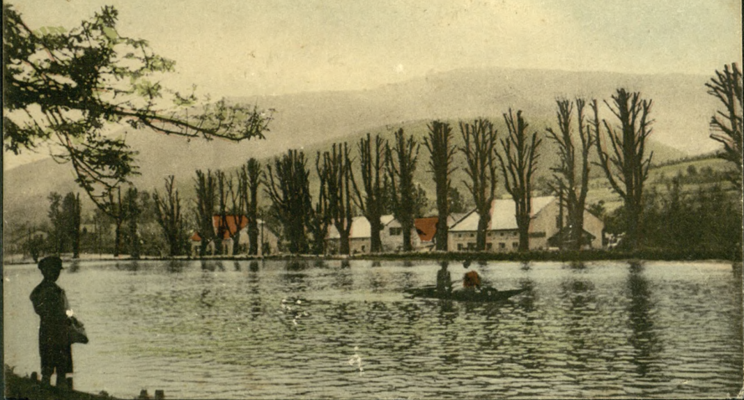
USTROŃ na Śląsku. Staw obok Hotelu Kuracyjnego.