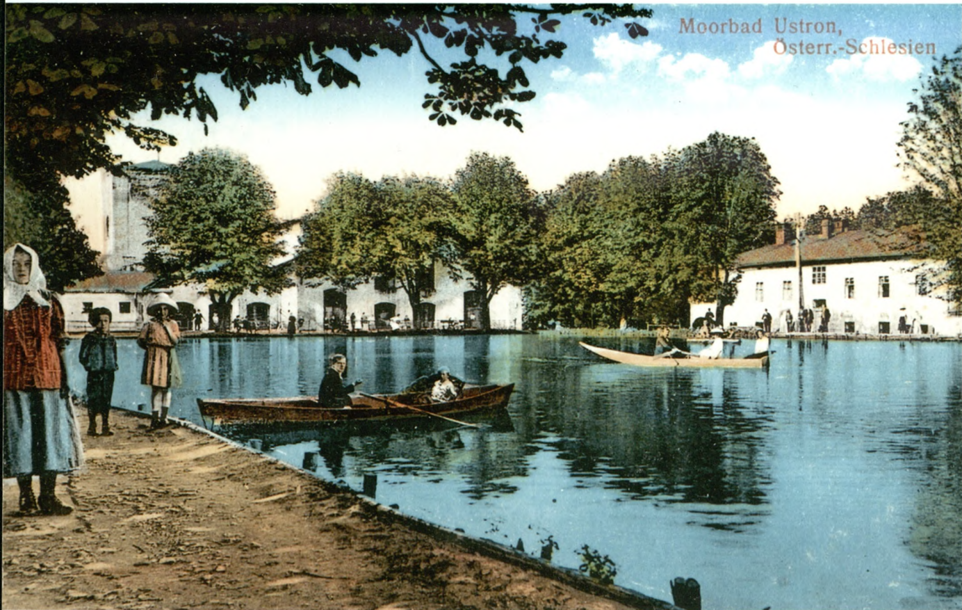
Moorbad Ustron, Österr.-Schlesien