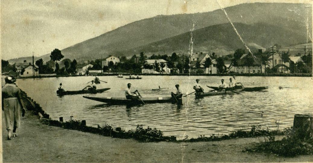
Ustronie. Sztuczny staw.