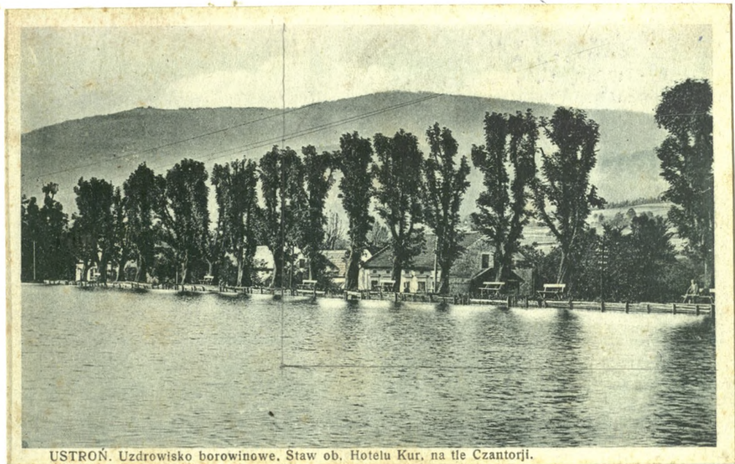
USTRONIE. Uzdrowisko borowinowe. Staw ob. Hotelu Kur, na tle Czantorji.