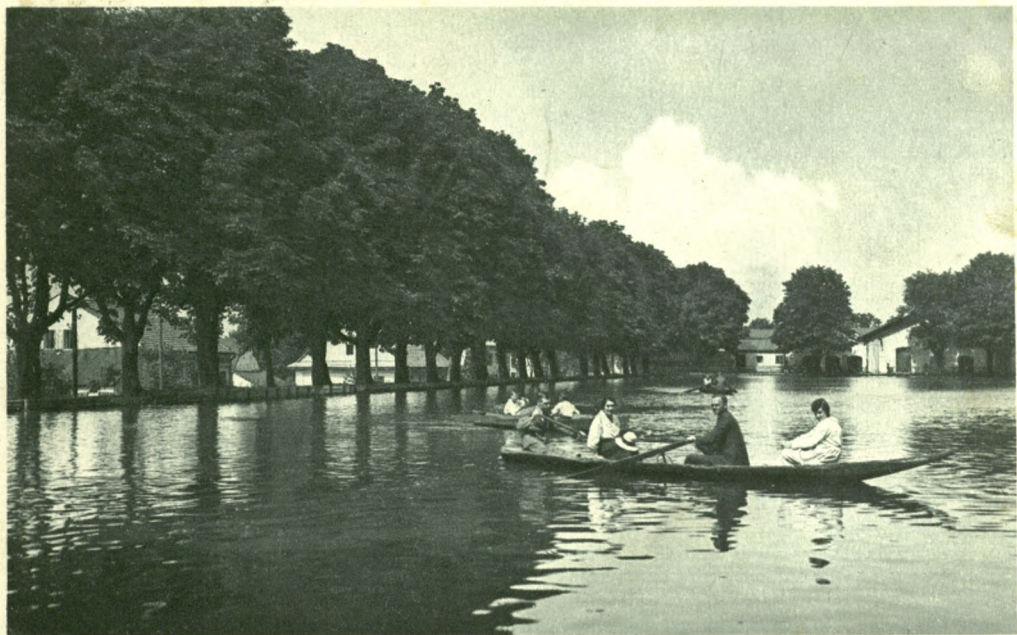
Ustroń na Śląsku.