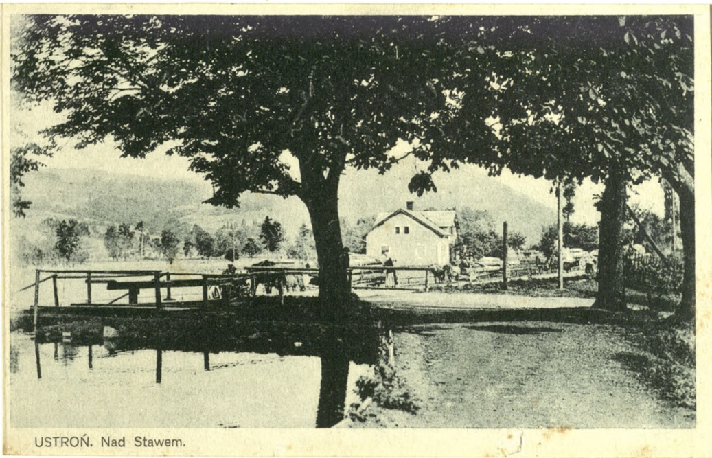
USTROŃ. Nad Stawem.