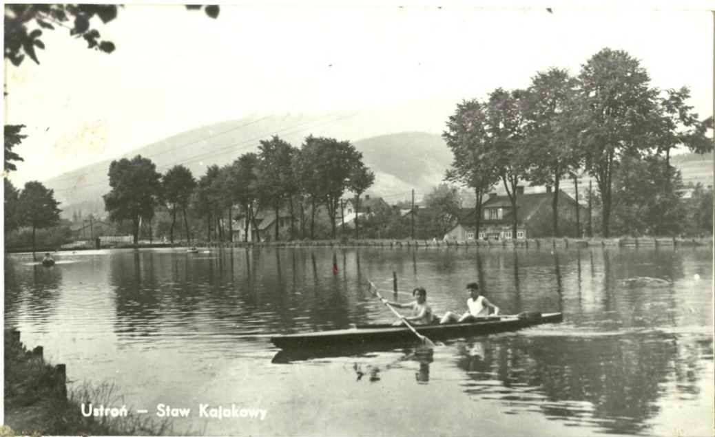
Ustroń – Staw Kajakowy