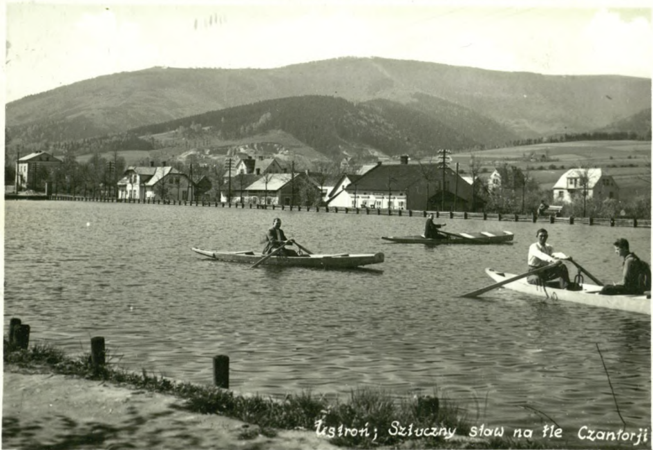
Łęstrowi; Szluczny staw na tle Czantorji