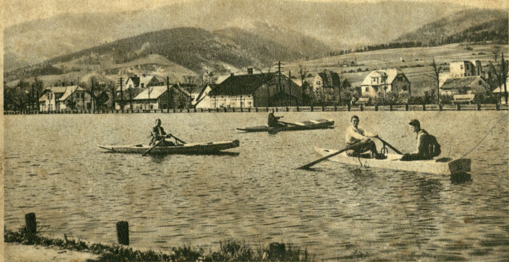
USTRON. Künstlicher Teich.