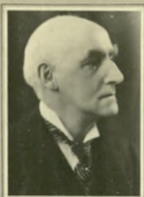
Tom Swift Peacock