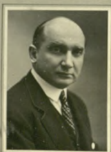
Erzellenz August Zaleski