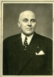
Präsident Ludwig Urban