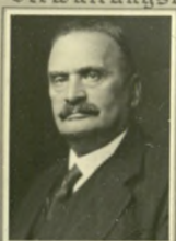
Ludwig von Neurath