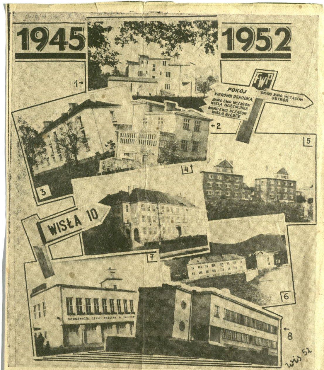
Wiele nowych obiektów powstało w okresie 8 lat Polski Ludowej. Na zdjęciu: 1) Dom nauczycielski w Cisownicy, 2) gmach Spółdzielni „Konsum Robotniczy” w Dziegielowie, 3) osiedle mieszkaniowe w Cieszynie, 4) rozbudowana szkoła ogólnokształcąca w Wiśle Centrum, 5) jasne, piękne domy osiedla robotniczego w Skoczowie, 6) domy mieszkalne pracowników Kuźni — Ustroń w Ustroniu, 7) budynek OSP w Skoczowie, 8) nowoczesna szkoła w nadgranicznej wsi — Górnej Lesznej.

Dar od Lechów Urbanów ze Stodajskich Kikosińskich Kuchni Ustroń