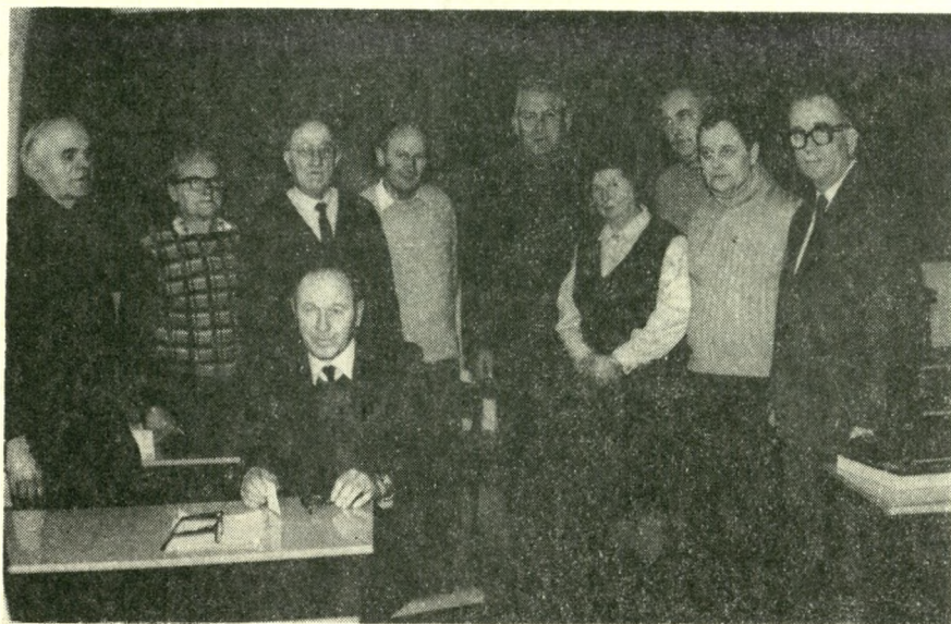
Filateliści ustronscy w czasie szkolenia

Szczególną uwagę Zarząd poświęca wiedzy fachowej swych członków. Dowodem tego jest szeroki zakres tematyczny prelekcji, które odbywają się w czasie miesięcznych zebrań członków. Było więc spotkanie i prelekcja przedstawiciela Komisji Wystaw ZO na temat: „Budowa zbiorów i przygotowanie ich do wystawy”. A oto kilka z wielu tematów prelekcji: „Kobieta na znaczkach PRL”, „Dzień Zwycięstwa”, „Dziecko w filatelistyce”, „40-lecie PRL w filatelistyce” oraz „LWP na polskich znaczkach pocztowych”. Zorganizowano również spotkanie z delegatem Okręgu na XIV Zjazd PZF.