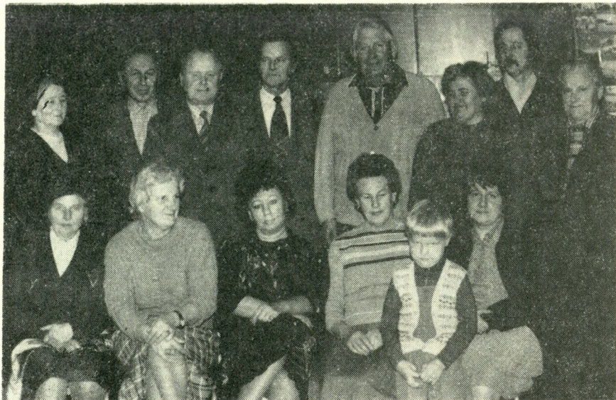
Uczestnicy uroczystej akademii z okazji „Dnia Znaczką”

Głowackiego. Któż w Ustroniu nie zna tego ofiarnego i zasłużonego społecznika, kto nie zna jego wkładu pracy przy budowie przystanku PKP „Ustroń-Zdrój”? To z jego inicjatywy przy poparciu licznych aktywistów założono Koło Terenowe nr 60 w Ustroniu, a sam nie tylko jest prezesem Koła ale i opiekunem Kół młodzieżowych. Wśród swoich podopiecznych i kolegów cieszy się sympatią i uznaniem.