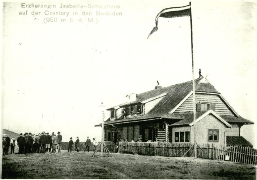
Erzherzogin Isabella-Schulzhaus auf der Czantory in den Beskiden (958 m ü. d. M.)