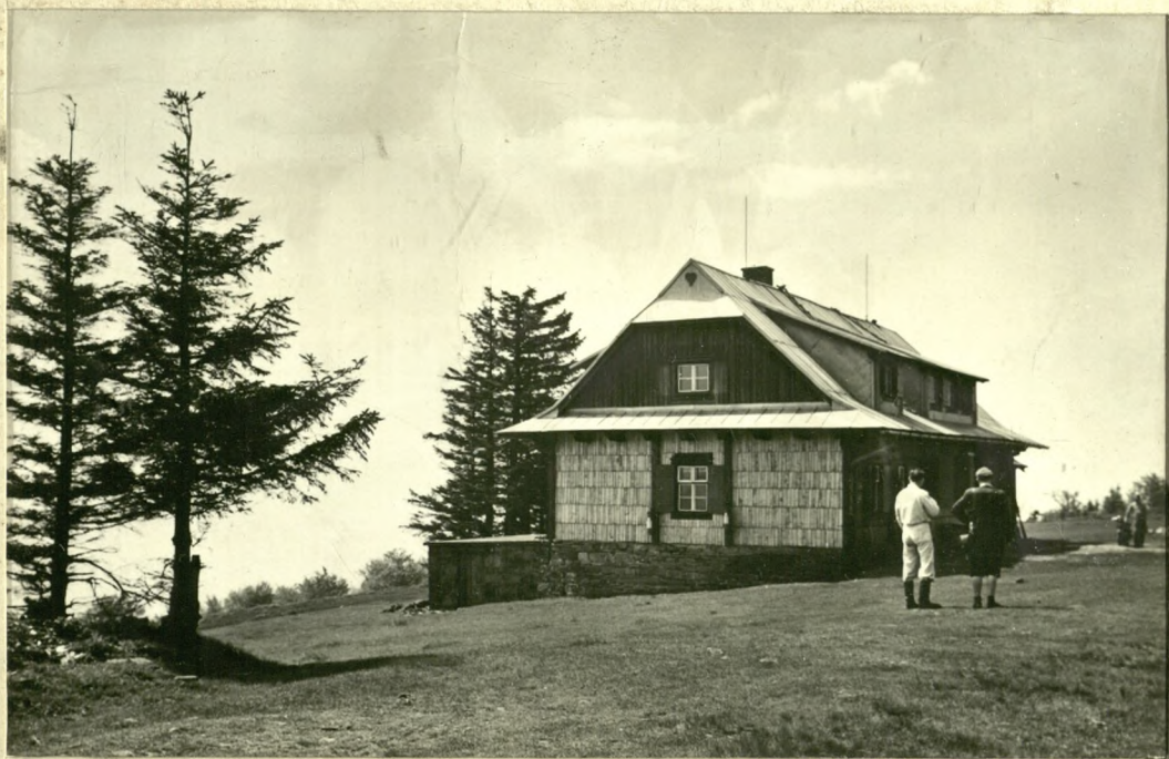
SCHRONISKO NA CZANTORII