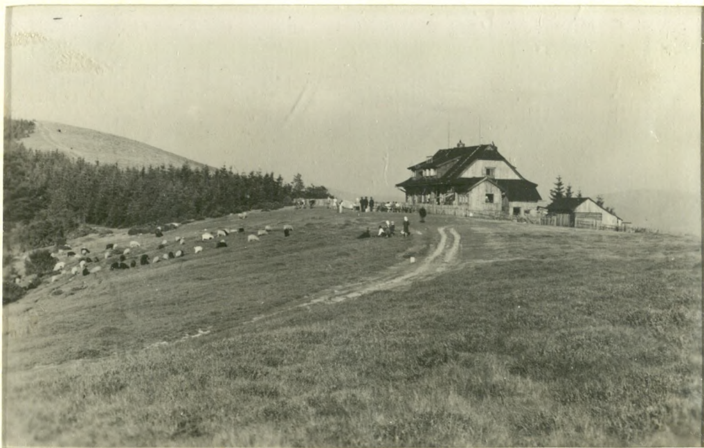
SCHRONISKO NA CZANTORII Cieszyn / -1933