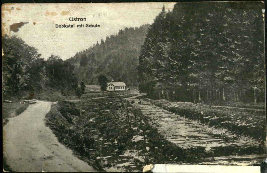
Ústron Dobkatal mit Schule