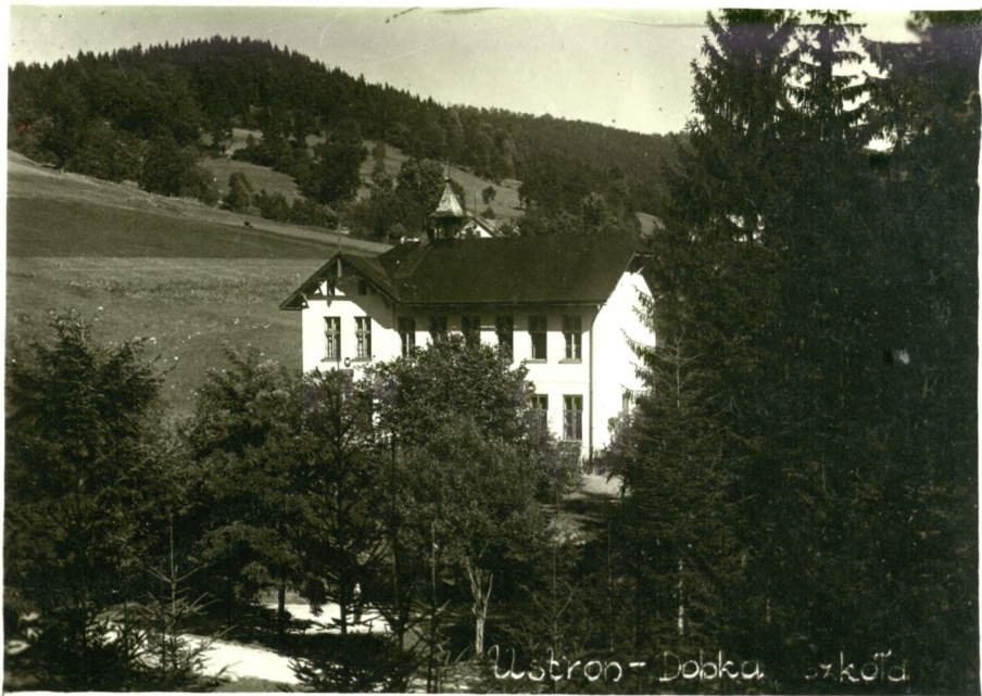
Ustron - Dobka szkoła