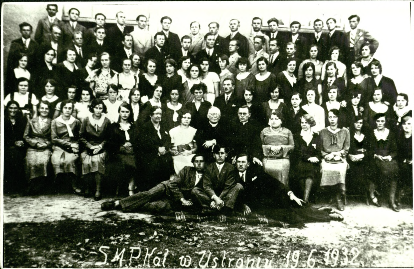
S.M.P. Klub w Ustroniu 19.6.1932.