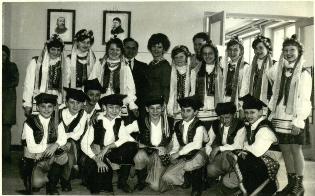
otwarcie nowej szkoły N. 1