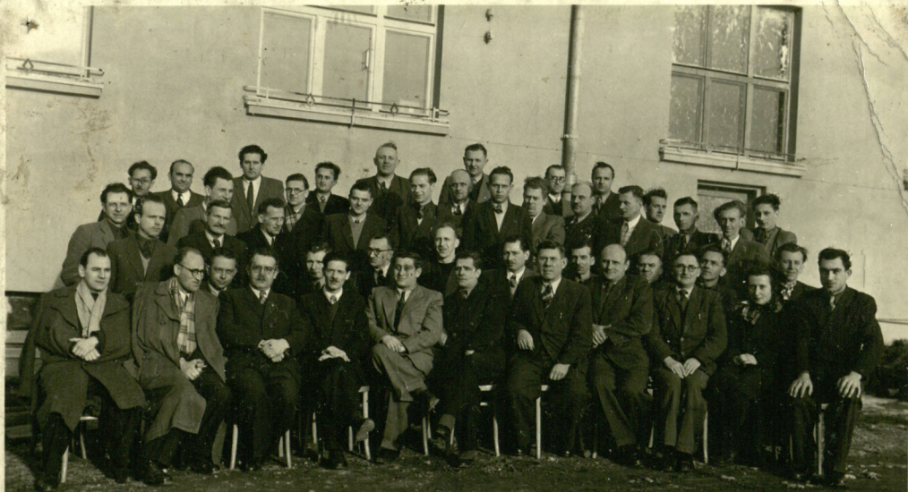
Kurs Głównych Mechaników 1951. w Elstronie.