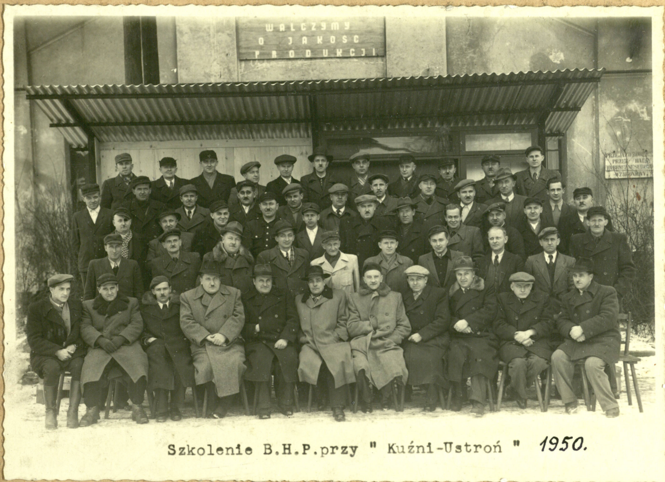
Szkolenie B.H.P.przy " Kuźni-Ustroń " 1950.