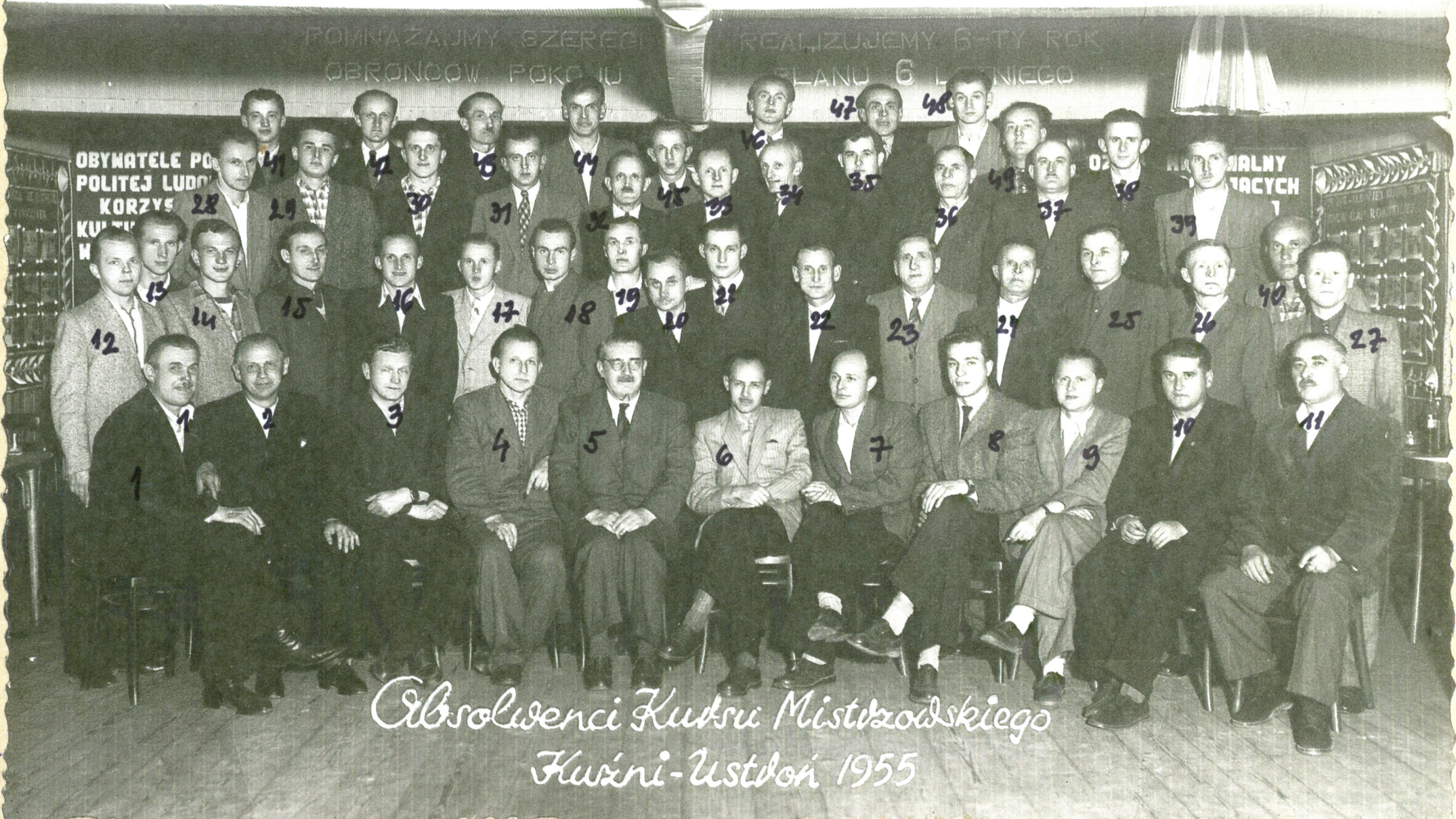
Absolwenci Kursu Mistrzowskiego Kuwzi-Ustłon 1955