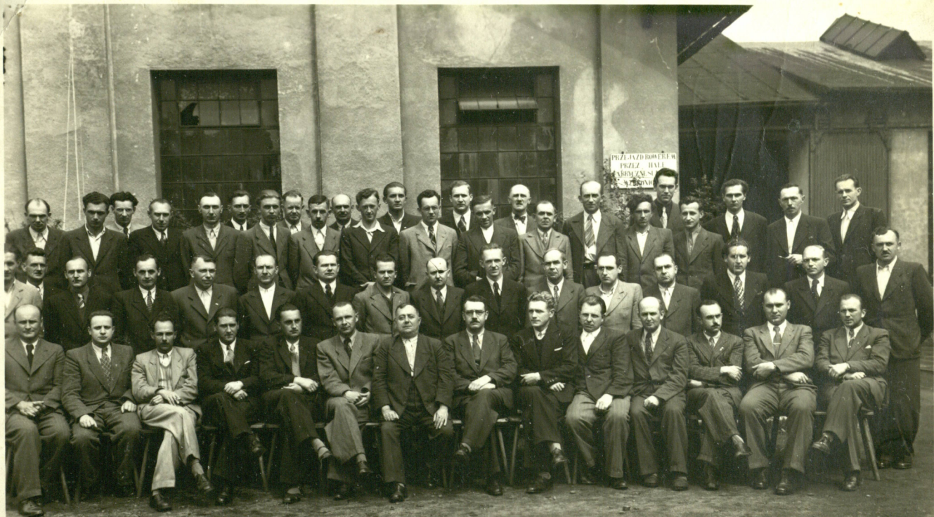
"Egz. mistrzowski" przy P.Z.K. w Ustroniu, 29 maja 1948 r.