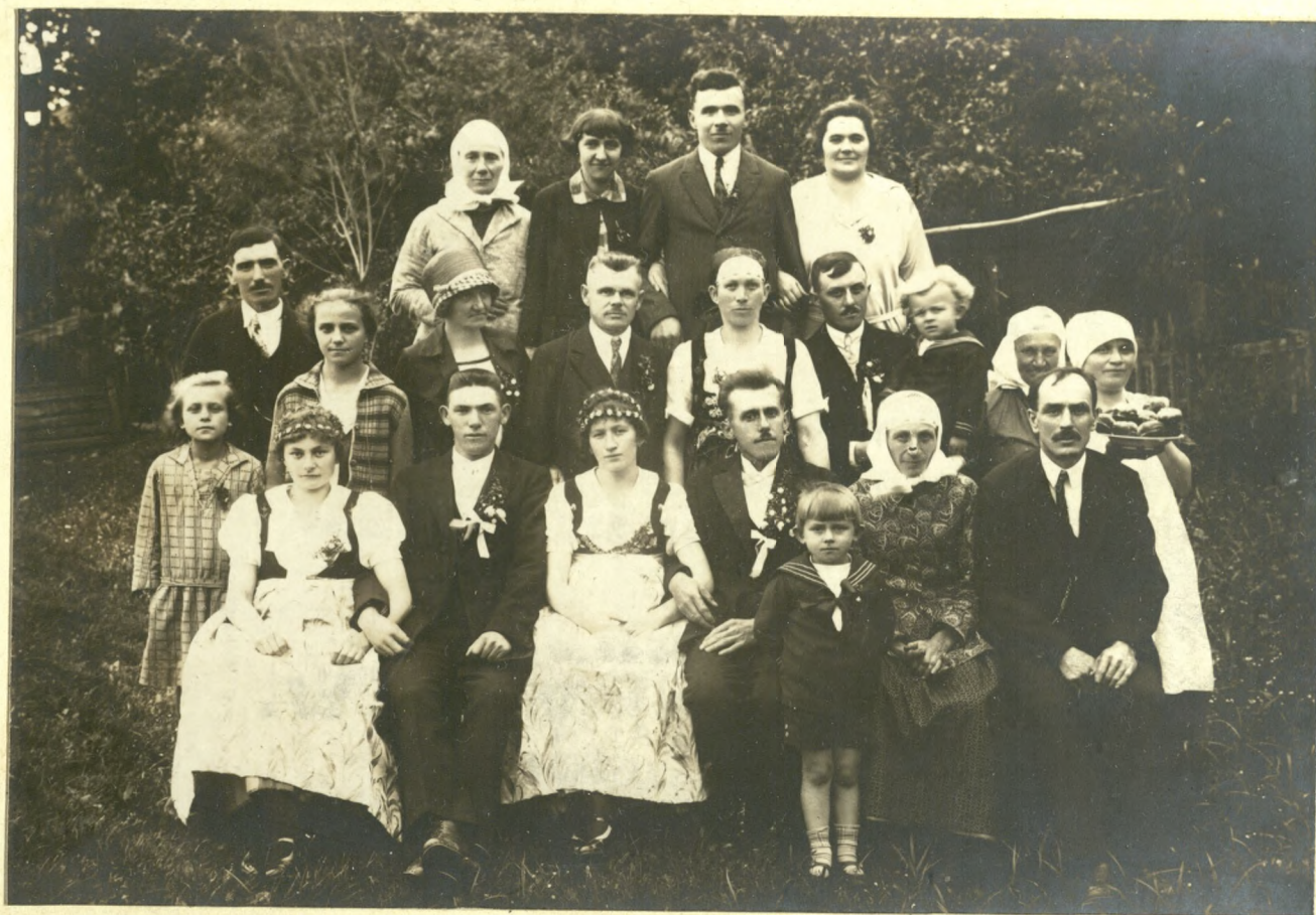
J. SKORA ZAKŁAD FOTOGR. USTRONŃ