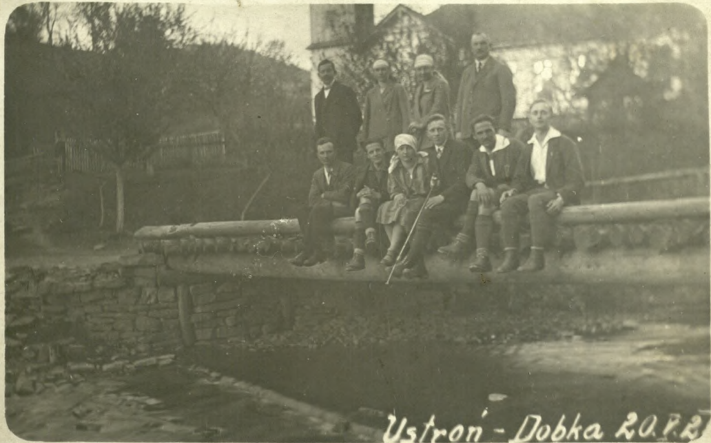
Ustron' - Dobka 20.7.22