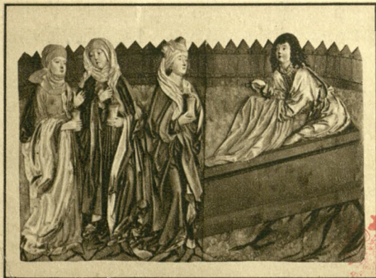
TRZY MARJE U GROBU. LES SAINTES FEMMES AU TOMBEAU.

KRAKÓW — KOŚCIÓŁ N. P. MARJI — GŁÓWNY OLTARZ WITA STWOSZA. C R A C O V I E — N O T R E - D A M E — L E M A Î T R E - A U T E L D E W I T S T W O S Z .