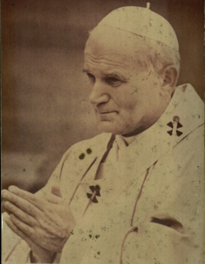
Joannes Paulus pp. II