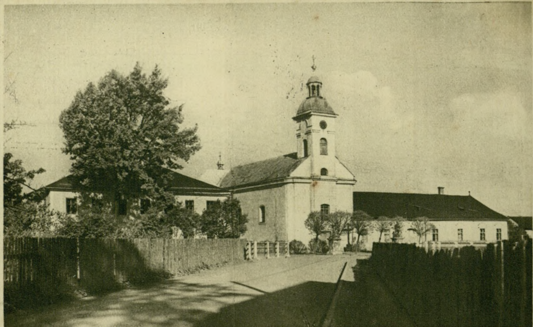
Uzdrowisko-Ustroń. Kościół Rzym. Kat., Szkoła i Plebanja