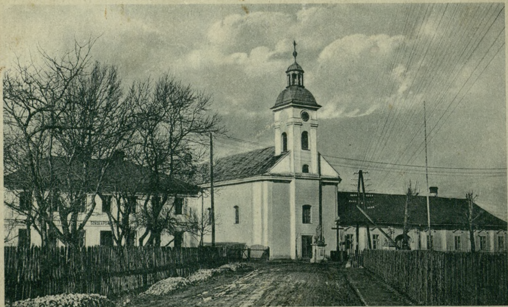
USTROŃ. Uzdrowisko borowinowe, szkoła, kościół kat. i plebanja.