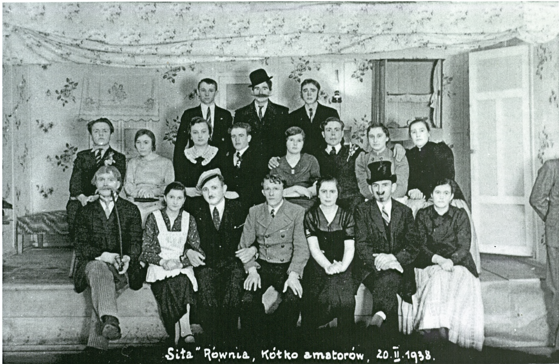
Sita "Równia, Kółko amatorów, 20. II. 1938.